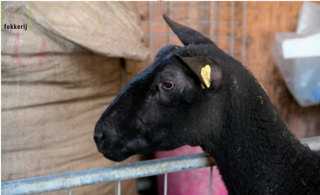
Een voorbeeld van een typisch melkschaap met de oren strak omhoog.

tweede trip, zo'n drie weken na de koop, bracht de gekochte ram of ooi dan in Nederland. "Inmiddels is bij het Duitse stamboek bekend dat er vanuit het Friese melkschapenstamboek belangstelling is voor bepaald fokmateriaal. Dat betekent dat we kunnen aangeven naar welke rammen onze voorkeur uitgaat. Die rammen worden dan exportklaar op de veiling aangeboden. Dit verplicht niet tot kopen. Schaf ik wel een nieuwe ram aan, dan kan die direct op de trailer mee naar huis. Alle benodigde papieren zijn aanwezig en de voor Nederland vereiste entingen zijn verzorgd. Het voorwerk is in de aanloop naar de veiling al gedaan."