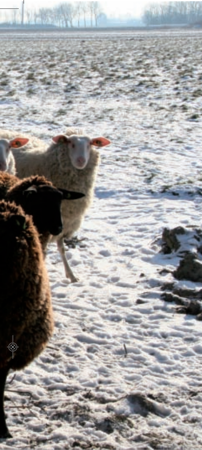
Zwarte en witte melkschappen samen in de wei.

Porte aangewezen op Duitse rammen. “Duitsland is eigenlijk het enige land waar deze kleurslag wordt gefokt”, vertelt ze.