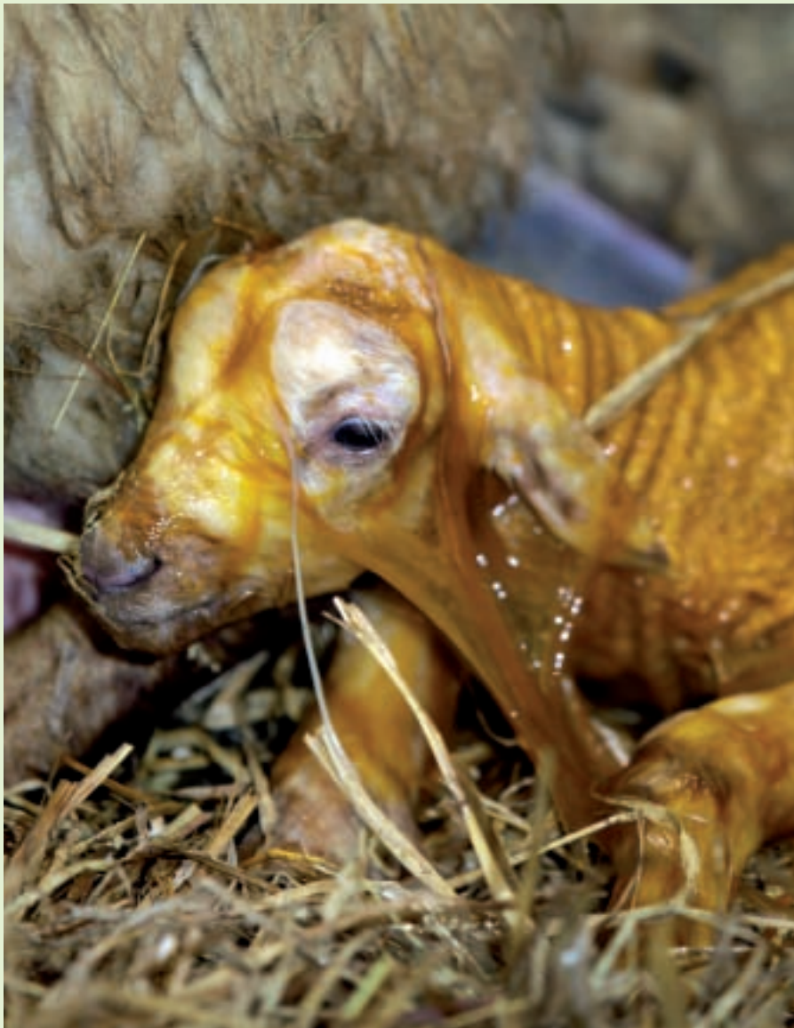
Nu proberen op te staan.