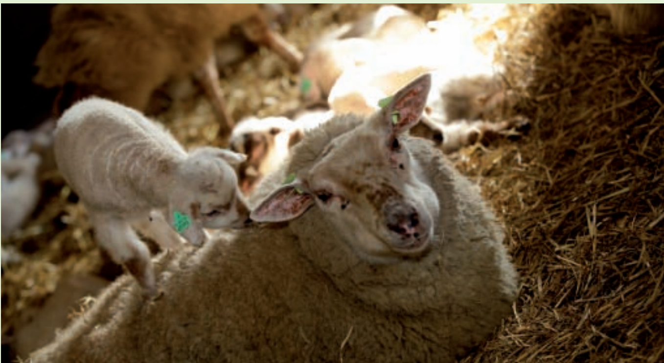
Kan het mooier?