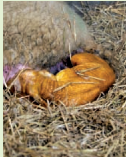
Het lam is geboren en tilt het kopje al op.