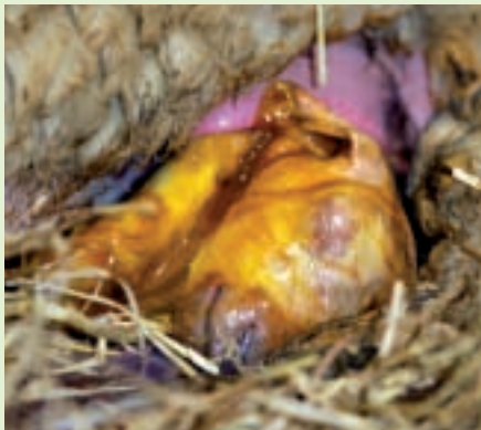
Kop en pootjes zijn eruit.