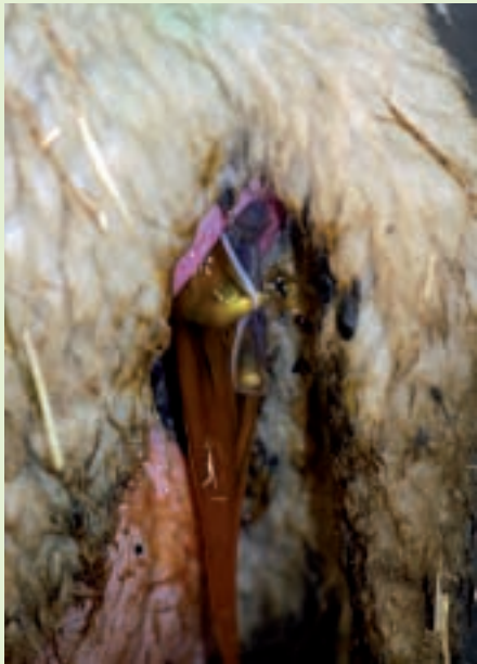
Het begin is er: de pootjes worden zichtbaar.