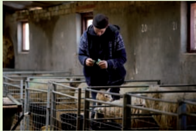
Voordat de ooi met haar lammeren naar een groepshok gaat, krijgen alle lammeren oormerken.