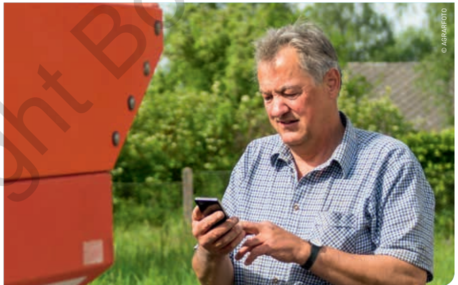
Apps zijn kleine programma's die draaien op een smartphone of tablet. Met behulp van een app is het mogelijk om eenvoudig extra functies aan een apparaat toe te voegen.

Alle apps moet je downloaden via verschillende app stores. De app store is niet meer dan een online winkel die je kan terugvinden via een specifiek icoontje op je smartphone. Elk type besturingsplatform heeft zijn eigen store. We bespreken enkele voorbeelden.