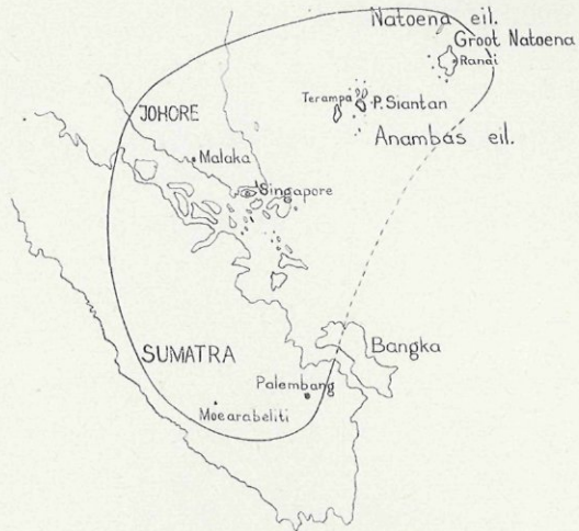
Verspreidingsgebied van Cr. griffithii Schott

Ten slotte merk ik nog op, dat uit het bovenstaande volgt, dat in onze aquaria geen C. griffithii wordt gekweekt (of misschien hoogst zelden). De soort, die tot voor kort wel een der meest algemene was en als C. griffithii bekend