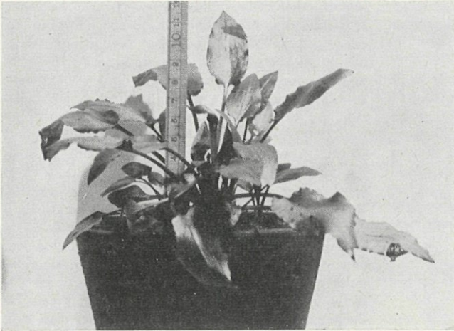
Cryptocoryne beckettii , groeiend in droogcultuur