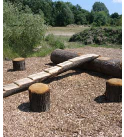
De boomstam is bewerkt met het oog op spelen en daarom een speeltoestel volgens het WAS.

voorzien zijn van een certificaat. De AKI onderzoekt daarvoor of een speeltoestel voldoet aan de veiligheids- en gezondheidsvoorschriften. De actuele lijst van aangewezen keuringsinstellingen is te vinden op de website van de NVWA. Een beheerder heeft twee mogelijkheden. Ten eerste kan een toestel met een typekeuring worden aangeschaft. Er hoeft dan geen keuring ter plaatse uitgevoerd te worden. Een tweede mogelijkheid is het laten keuren van een speeltoestel na de plaatsing, een zogenaamde eenmalige keuring. Hierbij wordt zowel gelet op het toestel zelf als op de plaatsing. Een eenmalige keuring ligt het meest voor de hand bij een zelfgebouwd speeltoestel. Eventuele aanpassingen aan speeltoestellen, hoe klein ook, kunnen de veiligheid er van aantasten. Ingrijpende aanpassingen (constructieve wijzigingen) kunnen er toe leiden dat het certificaat niet langer van toepassing is en dienen dus altijd te worden doorgegeven aan de instelling die de certificering heeft verricht.