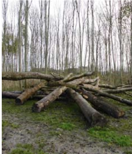
Deze boomstammen zijn opgestapeld op een speellocatie. De bestemming is dus spelen en het is daarom een speeltoestel volgens het WAS.

Om aan te kunnen tonen dat een speeltoestel aan de eisen van het WAS voldoet, moeten alle speeltoestellen eenmalig worden gekeurd door een aangewezen keuringsinstantie (AKI) en