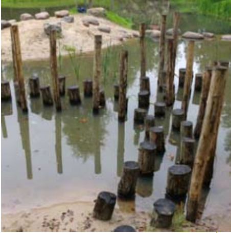
Deze stammen vormen door hun constructie een speeltoestel. Er gelden extra maatregelen in verband met het water.