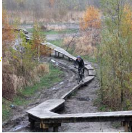
Gebouwde technische obstakels voor sporters, zoals hier voor mountainbikers, vallen niet onder het WAS, maar het is wel verstandig aan dezelfde eisen te voldoen

Door goed onderhoud moet er voor gezorgd worden dat een speeltoestel veilig blijft. Controleer daarom regelmatig de staat van het toestel. Draai bijvoorbeeld bouten en moeren aan, controleer of er geen slijtage aan kettingen is en/of check de laagdikte van de ondergrond. Eventuele defecten moeten binnen een verantwoorde tijdsduur gerepareerd worden. Als een speeltoestel tijdelijk of permanent niet meer veilig is, zorg er dan voor dat het speeltoestel niet meer toegankelijk is en er een bord geplaatst wordt waarop staat