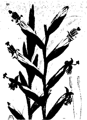
W.H. de Vriese