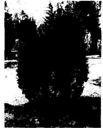
Frank N. Meyer