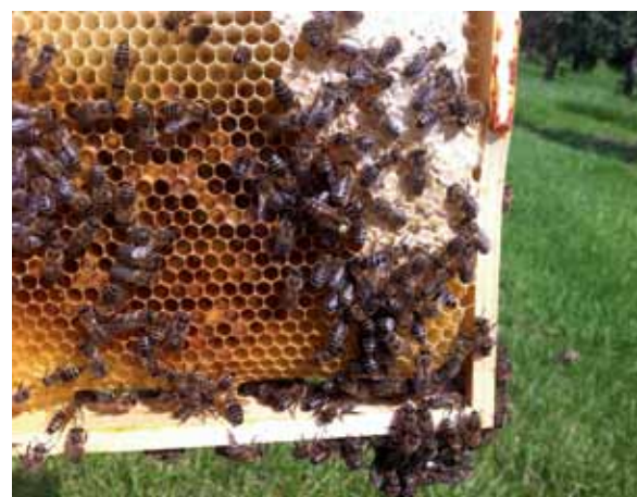
Koningin op de raat.

gemaakt van een andere dan de standaardopening. In de originele opening is n.l. niet goed te zien of er wel een darrenrooster aanwezig is. Op bevruchtigseilanden Ameland en Vlieland moet er daarom gebruik worden gemaakt van een speciale vliegopening: het zogenaamde 'Amelander rondje'. Nadeel hiervan is dat er een gat in de zijwand geboord moet wor-