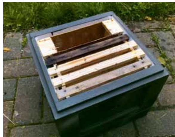
Voerbakje dat de ruimte inneemt van twee raampjes.