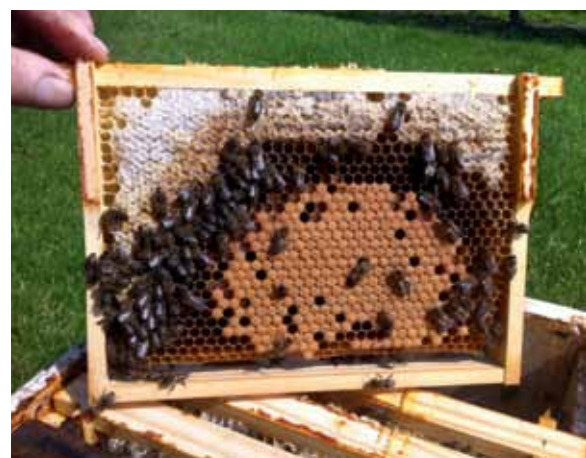
Mooi uitgebouwd en bebroed raampje.