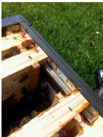
Glijstrip om te voorkomen dat de raampjes vast worden gekit.

Voor het gebruik op een bevruchtigstation moet er wel gebruik worden