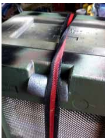
Sluiting van isolatiemateriaal.