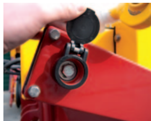
Bij de afdraai-proef hoeft je niet het loopwiel te draaien, maar deze bout met een dopsleutel.