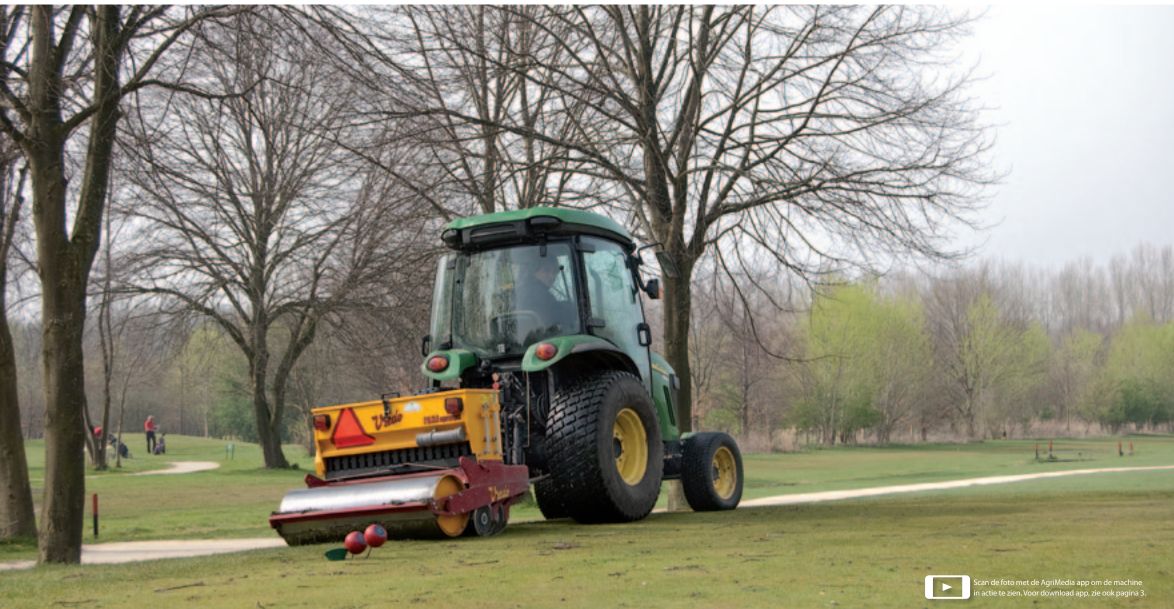
Scan de foto met de AgriMedia app om de machine in actie te zien. Voor download app, zie ook pagina 3.