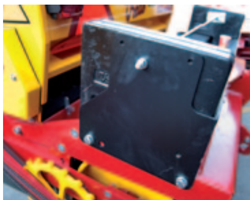
De Vredo heeft behoorlijk gewicht nodig om in een droge bodem te dringen.