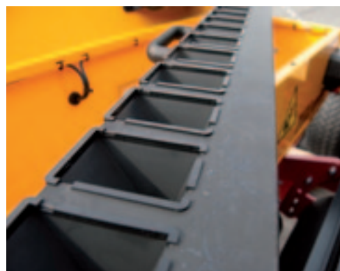
De trechters van de afdraaibak zijn kwetsbaar, maar kunnen per stuk worden vervangen.