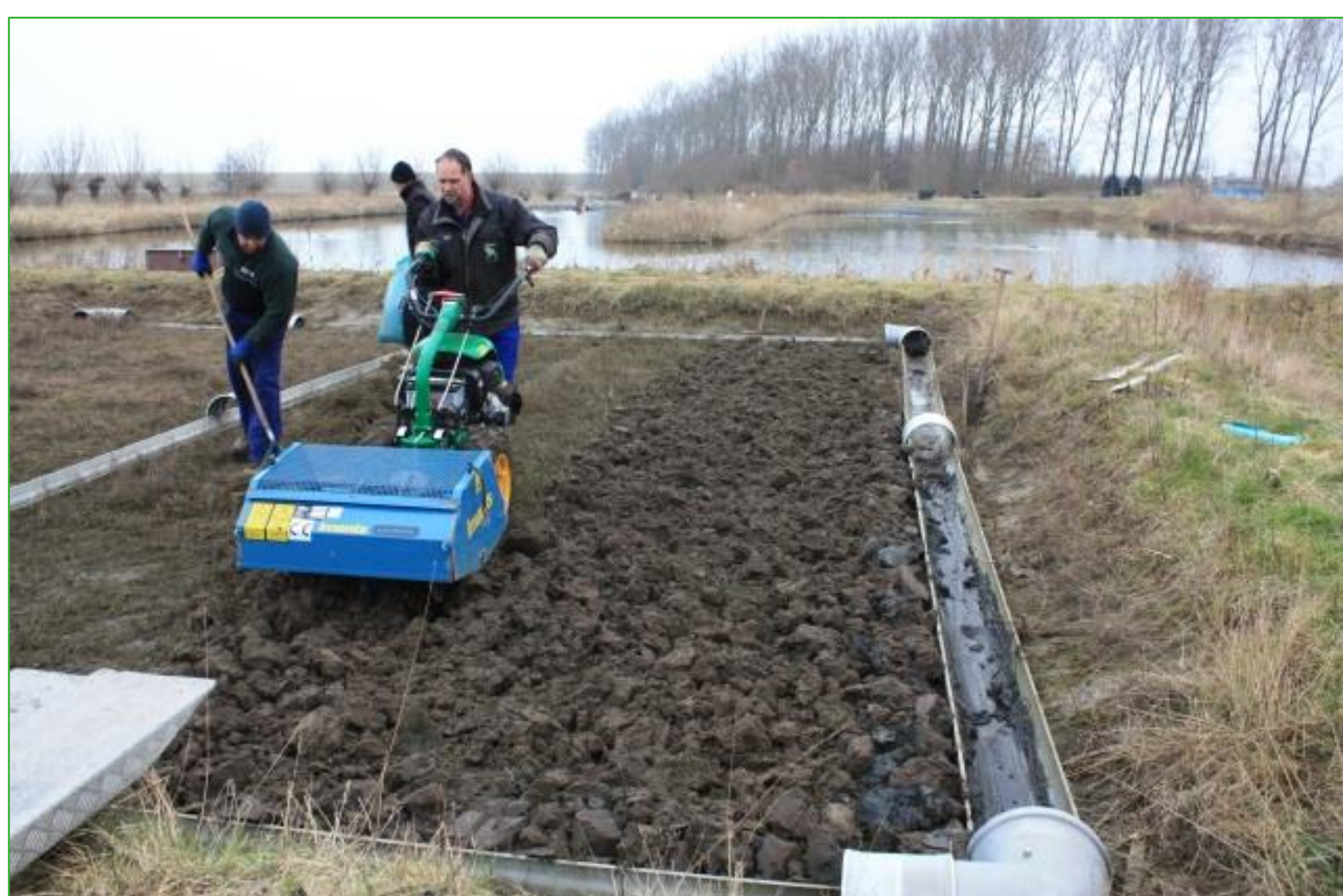
Figuur 1. Kerende grondbewerking.