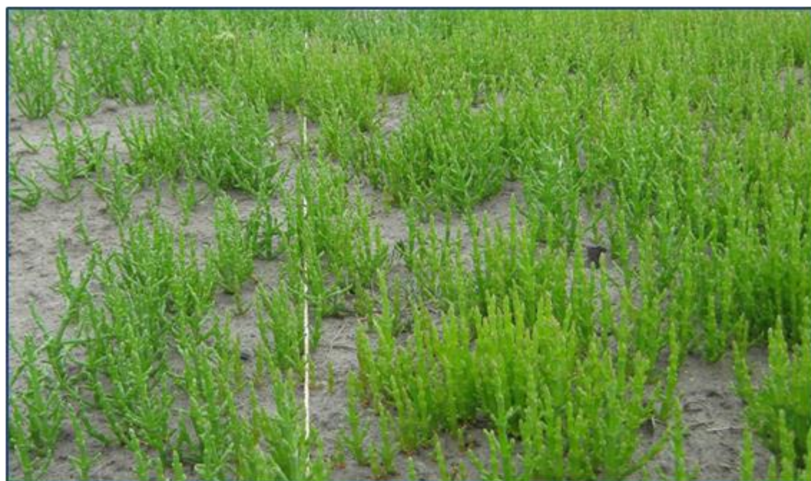
Figuur 2. Een zeekraalteelt.