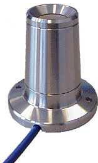
Afbeelding 1. Het prototype van de Hatech/EMS ethyleensensor

In mei/juni van 2003 is contact gelegd met de Firma Hatech, bekend als leverancier van de 'Kitagawa-buisjes' voor ethyleenbepaling. Hatech is een samenwerking aangegaan met EMS, een bedrijf gespecialiseerd in elektronische meetsensoren. De combinatie Hatech/EMS heeft toegezegd een ethyleensensor te leveren en deze geschikt te maken voor ethyleenmeting in tulpencellen, gekoppeld aan de celcomputer.