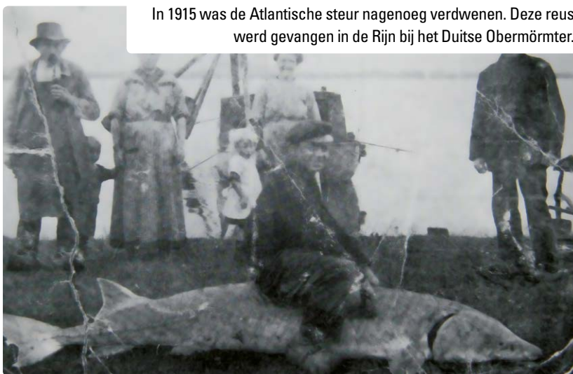
In 1915 was de Atlantische steur nagenoeg verdwenen. Deze reus werd gevangen in de Rijn bij het Duitse Obermörmt.

één niet te passeren stuw-sluiscomplex kan een hele populatie steuren doen verdwijnen. Als een vispassage geschikt wordt gemaakt voor een steur van drie meter dan zal dezelfde vistrap ook probleemloos te passeren zijn voor andere inheemse migrerende vissoorten als houting, zeeprick, rivierprick, zalm, zeeforel, elft, fint, spiering, driedoornige stekelbaars en paling. Een voorbeeld van zo'n passage is die in de Elbe die nabij Hamburg werd geplaatst.