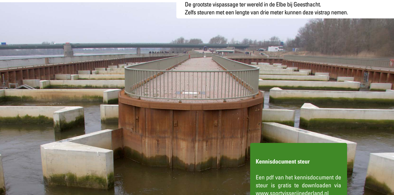
De grootste vispassage ter wereld in de Elbe bij Geesthacht. Zelfs steuren met een lengte van drie meter kunnen deze vistrap nemen.

Het werk aan de toekomst van de steur in Nederland staat dus zeker niet stil. Toegegeven, het gaat niet zo snel, maar dat kan ook niet. Datzelfde geldt ook voor Wasabi, Abad en Seve. Bij het vrijlaten in 2012 waren deze kindersteurtjes drie tot vijf jaar oud. Een mannetjessteur heeft 10 tot 12 jaar nodig voordat hij klaar is om te paaien. Bij een vrouwtje moeten we zelfs denken aan 14 tot 16 jaar. Op zijn vroegst kunnen we Wasabi, Abad en Seve daarom pas in 2018 terugverwachten. Mogelijk helpt de geplande 'Kier' in de Haringvlietsluizen de vissen dan verder. Het zou ook zomaar kunnen dat ze uiteindelijk toch de haven van Rotterdam verkiezen. Voor het herstel van de steur moeten we vertrouwen op het kiezen van de vrijheid van Abad, de volharding van Seve, maar ook van de organisaties Wasabi, en heel veel mensen in binnen- en buitenland die natuurherstel een warm hart toedragen. V