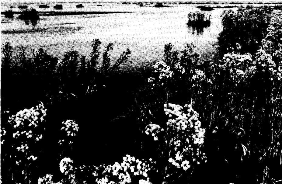
en aan gene zijde van de Dollarddijk

besprekingen ook verklaren, die momenteel gaande zijn over het beheer van de kanalen in het Herinrichtingsgebied. Gegeven de belangen die in het geding zijn en gerelateerd aan de onderscheiden beheeraspecten ligt hier naar mijn oordeel in de eerste plaats een taak voor het waterschap en de gemeenten. Overigens – maar dit terzijde – mag u uit mijn opvattingen over decentralisatie concluderen dat ik voor wat betreft het beheer van de hoofdkanalen op het standpunt sta, dat de provincie dit moet blijven doen. Juist ook vanuit een optimale afstemming van de belangen van scheepvaart en waterhuishouding, is de provincie hier het meest aangewezen orgaan. Bij de herordening van taken zal voorsnog – zeker bij de huidige