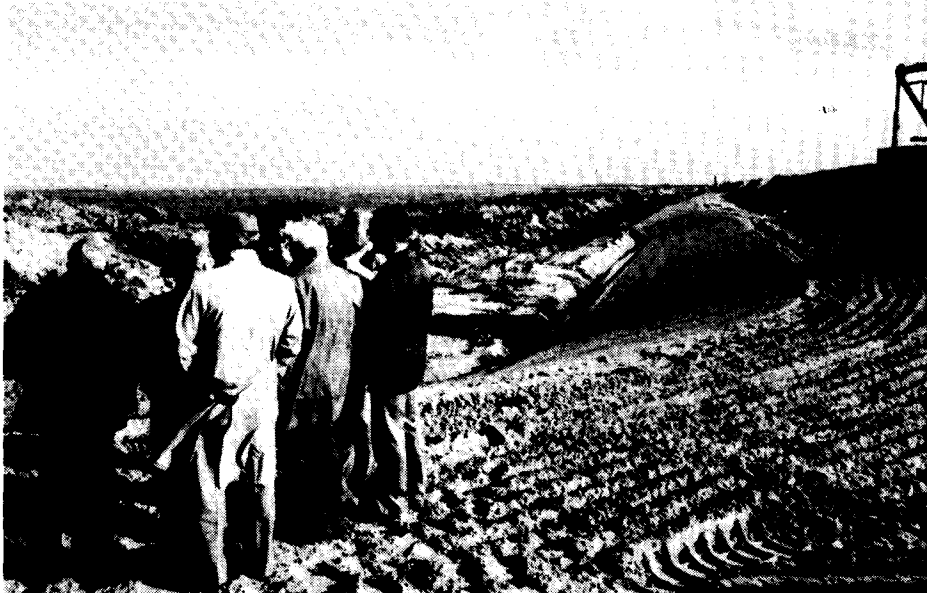
Aan deze . . .

Gezocht moet worden naar een doelmatige rolverdeling in de waterstaatszorg, met name tussen provincie en waterschappen. Naar mijn mening houdt de provincie zich op dit moment bezig met teveel uitvoerende taken op dit beleidsterrein. Mede daarom is de provincie op dit ogenblik bezig met een inventarisatie van belangen en een analyse van de eigen inspanning op het terrein van de waterstaatszorg. Deze operatie zal moeten leiden tot een herordening van taken bij het vaarwegenbeheer en het waterkwantiteitsbeheer. Daarbij speelt het feit dat in de nieuwe Wet op de waterhuishouding nieuwe instrumenten aangereikt zullen worden om de verantwoordelijkheid van de provincie in het vorm geven aan een gecoördineerd waterbeheer vanzelfsprekend een rol. Tegen deze achtergrond moet u de