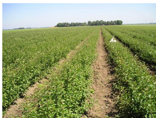
Figuur 2. Proefveld op 20 juli 2011