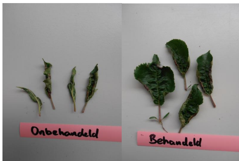
Figuur 3: In velden behandeld met Movento waren de aangetaste bladeren minder omgekruild (rechts), dan onbehandelde velden (links).