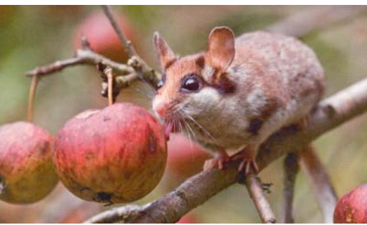
Het zijn echte smulpapen.

Cruciaal voor hun matige bekendheid is waarschijnlijk hun manier van leven, de dieren zijn absolute langslapers. Ze brengen bijna de hele winter in diepe slaap door. Tot het einde van de zomer eet hij zich vol met een dik wintervet, om dan van oktober tot mei te gaan slapen, dus een goede zeven tot acht maanden te kunnen doen zonder voedsel. Zijn lichaamsactiviteit wordt tot een minimum beperkt: 3 o lichaamstemperatuur en 35 hartslagen per minuut in plaats van de gebruikelijke 450 hartslagen per minuut!