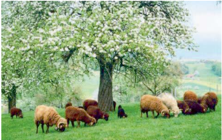
Lieflijke schoonheid in alle rust (onder en boven).

Present, Haneman, Zoete Erveling, Enkele Griet, Grote Zoete, Soete Kroon, Beugelzoet, Zoete Eva, Zoete Waard, Zoete Bobbert, Zoete Hooilaars, Breede Zoete, Zoete Streepjesappel, Zoete Anijsappel, Soete Son-Appel, Wijnzoet, Binderzoet, Winterbloemzoet, Zoete Bellefleur, Zoete Rouweling, Zoete Candij, Zoete Ribbeling, Spaansche Gulderling, Peerzoet, Zoete Ananas, Zoethout, Zoete Koningspippeling, Honderdmark, Geelzoet, Dijkmanszoet, Witte Soete-Silverling, Geele Soete-Silverling, Zoete Veentjesappel, Dubbele Zoete Aagt, Rijnzoet, Honingzoet, Zoete Calvijn, Vlamme Zoetje, Pomperanje, Uitgeester Zoet, Herfstbloemzoet, Zoete Tulp, Zoete Crombach, Zoete Paradijs en Zoete Dolphijn.