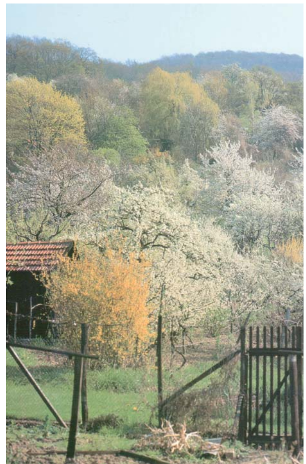
Weer zo'n verloren hoekje.