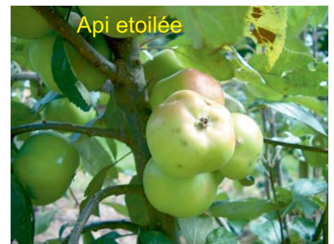
Hier nog enkele oudjes.