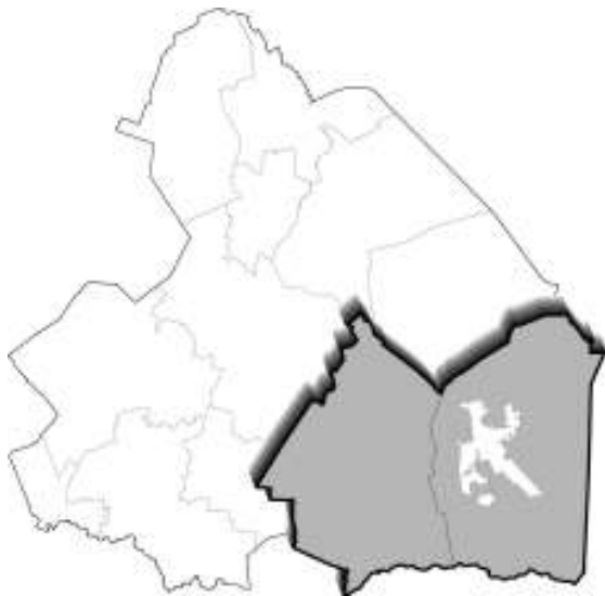
Figuur 1. LEADER-gebied

Het LEADER-gebied 1 heeft een oppervlakte van 555 km 2 en per 1 januari 2006 woonden er 88.200 mensen. Het aandeel in de Drentse bevolking bedraagt daarmee 18%. De bevolkingsdichtheid in het LEADER-gebied is in vergelijking met Nederland laag: 159 inwoners per km 2 , terwijl dit voor Nederland 483 is. Het LEADER-gebied kan daarom worden aangemerkt als een dunbevolkte regio.