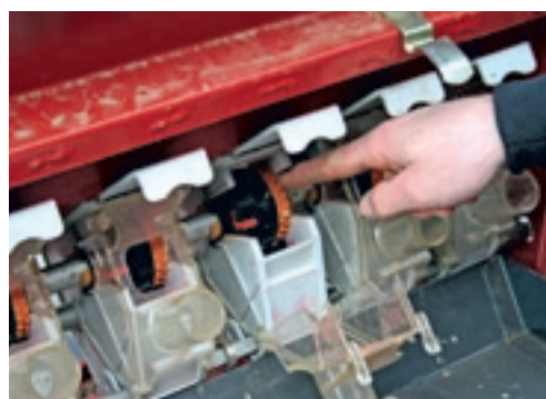
Om fijne zaden te zaaien, gebruik je het fijne nokkenrad. Voor grove zaden draaien ze allebei.