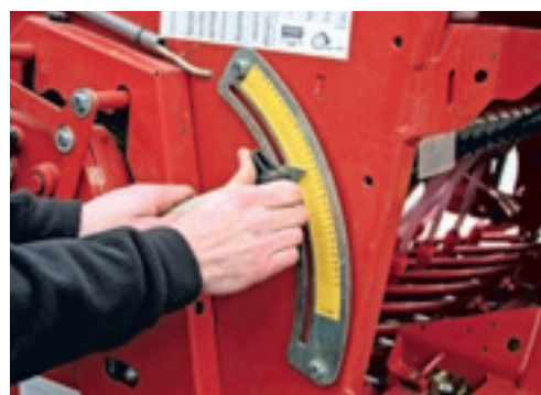
De dosering aanpassen doe je eenvoudig door de hendel te verplaatsen.