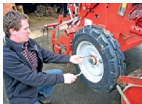
Door de zwengel op het wiel te plaatsen, kun je de afdraaioproef uitvoeren.