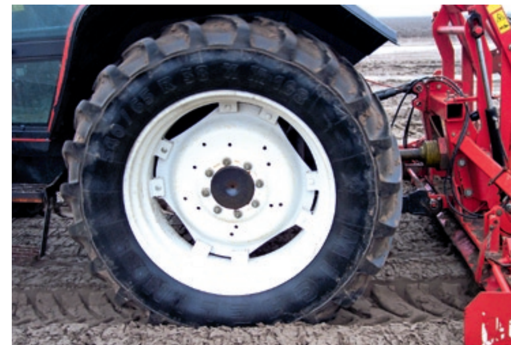
▲ Voor zo optimaal mogelijke groeiomstandigheden kun je bij een band kiezen tussen draagkracht, trekkracht, profilering en bandenspanning in relatie tot de bodemeigenschappen zoals grondsoort en bodemstructuur.

De bodemdruk wordt in sterke mate bepaald door de bandenspanning. Een vuistregel zegt dat de bodemdruk direct onder de band 1,25 maal zo hoog is als de bandenspanning (in bar). Op een diepte die gelijk is aan de bandbreedte is de bodemdruk maar de helft van de bandenspanning, en op een diepte van tweemaal de bandbreedte is bodemdruk door de band nagenoeg verdwenen. Om een juiste bandenspanning te bereiken kun je informatiebronnen van de bandenfabrikanten raadplegen. Dan kun je met name denken aan tabellen of grafieken met de load-index: hoe hoog moet de bandenspanning zijn bij bepaalde last en snelheid. LM