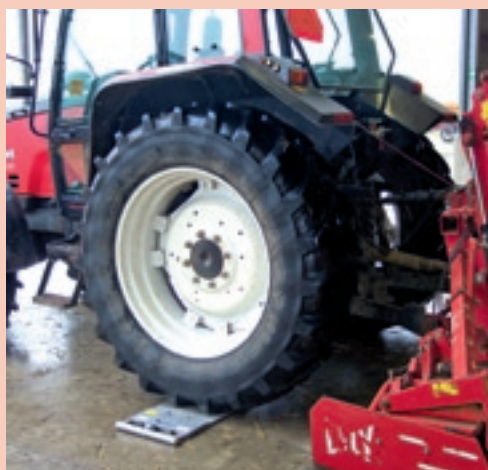
▲ Met een weegplaat onder de achterband van de trekker kun je precies meten hoe groot de last is die deze band moet dragen. Vanzelfsprekend heeft niet iedereen zo'n hulpmiddel. In dat geval moet je het gewicht van trekker en werktuig schatten en dan voor de verschillende banden de last bepalen.