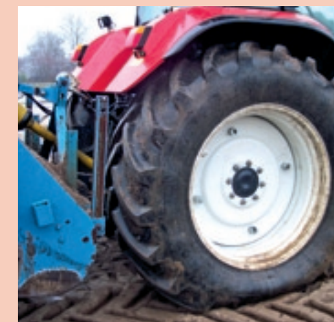
▲ Als de band op de goede spanning is gebracht, lijkt het wel of de band te zacht is. De trekkerbanden zijn evenwel gemaakt om met deze lage spanning te kunnen omgaan, waardoor het doel, overbrengen van trekkracht, goed tot zijn recht komt, zonder te veel schade in de bodem aan te richten.