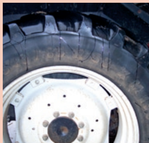
▲ Vervolgens moet je de informatie op de band aflezen die je nodig hebt om de bandenspanning te bepalen. Elk merk heeft zo zijn eigen wijze om de karakteristieken van de band weer te geven. Soms is het flink zoeken, zeker als de band door het werk vervuild is. In dit geval gaat het om een band met de codering 540/65 R38 XM 108.