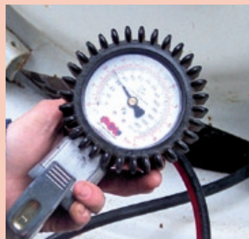
▲ Wat je ook moet weten is de bandenspanning. Op de foto lezen we op de spanningsmeter af dat er ruim 2 bar in de band zit. In de praktijk kan het voorkomen dat de meter door ouderdom of door slijtage niet meer de correcte stand weergeeft. In dat geval moet de meter geijkt worden om te bepalen of hij nog wel betrouwbaar is.