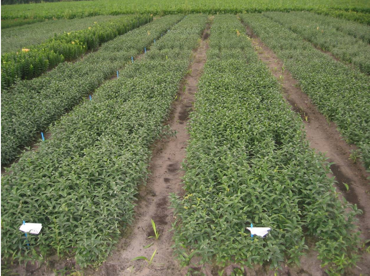
Foto 4 De stand van het gewas op 7 augustus 2008, tussen de lijnen ligt het controle vak

Op 7 augustus 2008 werd de stand van het gewas nogmaals beoordeeld.