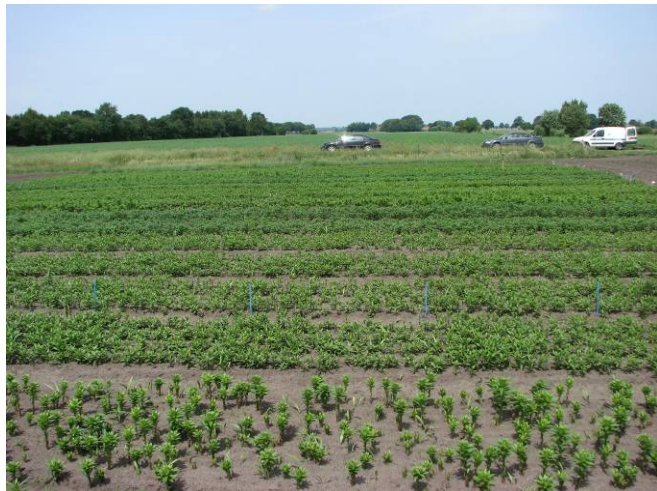
Foto 1 Overzicht proefveld op 2 juni

De enige lelieplanten die een belangrijk mindere gewasstand hadden waren de lelies die in het onbehandelde controlebed stonden. Later werd dit verschil alleen maar groter.