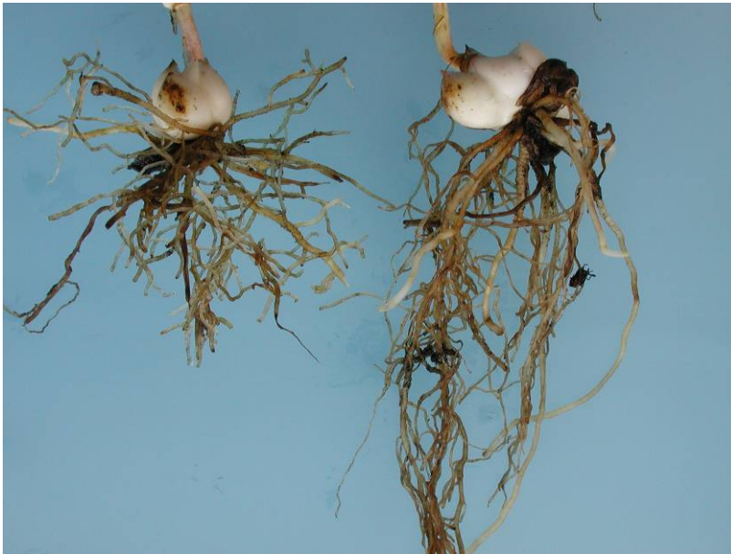
Foto 3 De eerste symptomen van onbekend wortelrot in cultivar Menorca en Brindisi op 7 juli 2008

Uit de nieuwe bolwortels in cultivar Menorca en Brindisi met beginnende symptomen van het onbekende wortelrot zijn ook isolaties gemaakt. Daarbij werden voornamelijk de schimmels Trichoderma en Fusarium gevonden.