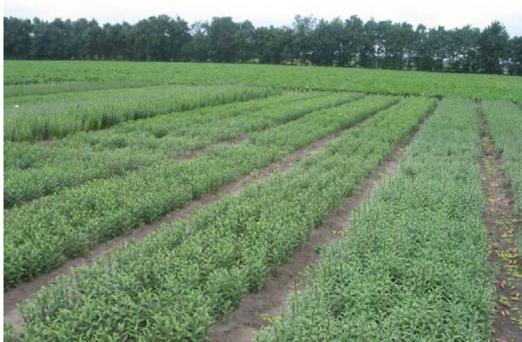
Foto 2 In het midden van het perceel is een strook achterblijvende lelies te herkennen die dwars op de bedden staat. Dit is de onbehandelde controle