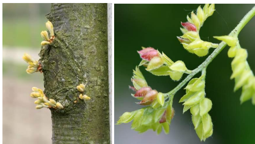
Figuur 2. De muggen van de eerste generatie vliegen als de eerste groene delen verschijnen en leggen hun eieren op de uitlopende knoppen (foto links). De aantasting leidt tot de typische roodgekleurde gallen (foto rechts).