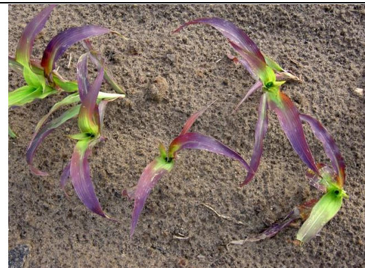
Fosfaatgebrek in mais: paarsrode verkleuring van de bladeren