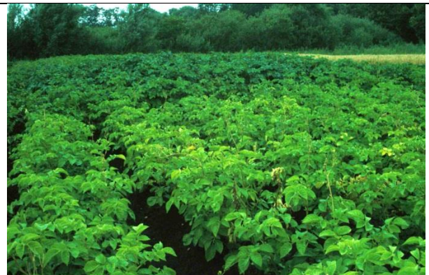
Proefveld met stikstofgebrek in aardappel. Het voorste deel toont duidelijk kleinere, gele planten.