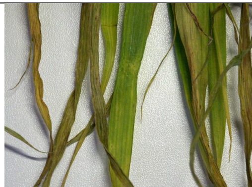
Mangaangebrek in gerst: bruine vlekjes in strepen over het blad