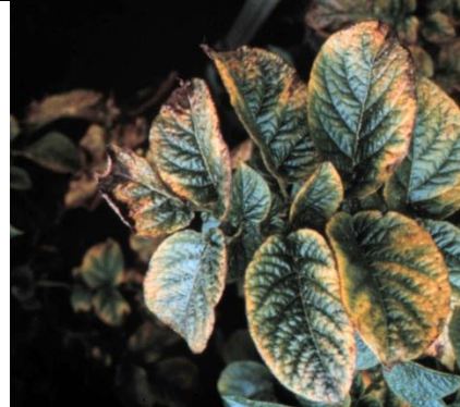
Aardappelblad met ernstig kaligebrek: tussen de nerven bobbelig blad met gele bladranden.