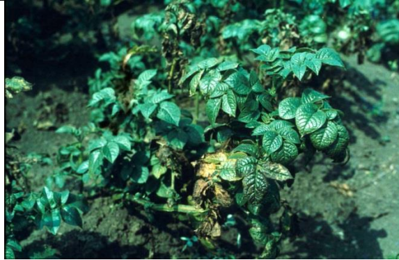
Symptomen van kaligebrek in aardappel: glimmend blad dat naar brons verkleurd en onderin geel wordt.

het seizoen te zien. Bladeren zijn gebobbeld, krullen naar binnen, met bruine bladranden en bruine vlekken tussen de nerven. Oude bladeren verwelken en sterven af (vaak in combinatie met Rhizomanie of Ramularia).