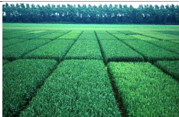
Een stikstofbemestingsproef in tarwe, met duidelijke verkleuringen.

Stikstofgebrek uit zich vooral in vertraagde groei en bleke, gelige planten. Helaas worden deze symptomen ook door allerlei andere problemen veroorzaakt (stagnerend water, bodemziekten, aaltjes, enz.). Granen met stikstofgebrek stoelen slecht uit en rijpen versneld af. Mais met stikstofgebrek wordt sterk in de groei geremd en oogt geel. Bladpunten sterven af en dit breidt zich wigvormig uit langs de hoofdnerf naar beneden. Bij aardappel leidt stikstofgebrek tot kleine, gele, slappe planten. Bladeren sterven af, te beginnen bij de bladpunten. Bij suikerbieten blijven planten achter in groei, worden geel en het blad staat steil omhoog.