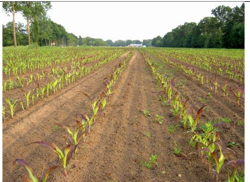
Fosfaatgebrek in mais: paarsrode verkleuring van de bladeren.

Planten reageren op tekorten aan essentiële voedingsstoffen met kenmerkende symptomen, zogenaamde gebreksverschijnselen. Deze kaart helpt om enkele belangrijke signalen van nutriënten-tekorten te herkennen. Maar tegelijk kunnen algemene symptomen, zoals vergeling van planten, door heel veel verschillende oorzaken ontstaan; kijk dus altijd breder dan alleen naar de voedingsstoffen. Neemt u zulke symptomen waar, dan is het tijd om samen met uw adviseur naar mogelijke oorzaken te zoeken. Indien de bodemvruchtbaarheid een mogelijke oorzaak lijkt, laat dan een bodemonderzoek doen en/of een plantensap analyse uitvoeren om dat te verifiëren.