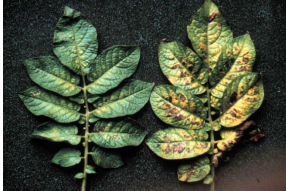
Magnesiumgebrek in aardappel: geel tussen de nerven, waarna bruine plekken ontstaan.

het gewas en gelige vlekjes ('wolkjes') in het blad, dat ook wel tijgering wordt genoemd. Bij mais ontstaan kenmerkende gele strepen op het blad. Magnesiumgebrek in aardappel is vooral zichtbaar op oudere bladeren, onderin het gewas. Het blad kleurt geel tussen de nerven, waarbij de bladranden nog lang groen blijven. Daarna verschijnen er aan beide kanten van de hoofdnerf bruine vlekken. Bij suikerbieten lijkt magnesiumgebrek veel op de vergelingsziekte, maar het blad wordt niet hard en broos zoals bij de vergelingsziekte.