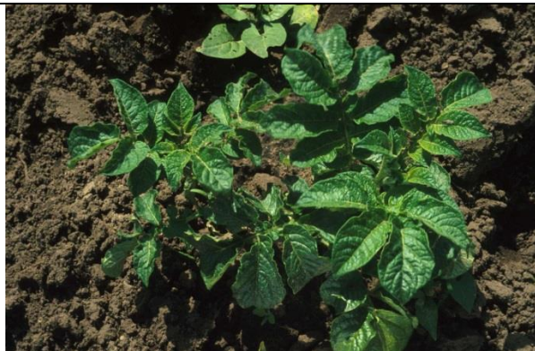
Fosfaatgebrek in aardappel: donkere bladeren met een golvende bladrand

Fosfaatgebrek in granen en mais is herkenbaar uit een smalle, spitse groei en vaak rood- en paarsverkleuring van de bladtoppen. Vooral onder natte, koude condities in het voorjaar treedt dit op. Ook bij suikerbieten geeft fosfaatgebrek een paarsrode bladverkleuring. Bij aardappel zijn de planten kleiner en donkerder, het blad is donkergroen en de bladranden zijn golvend.