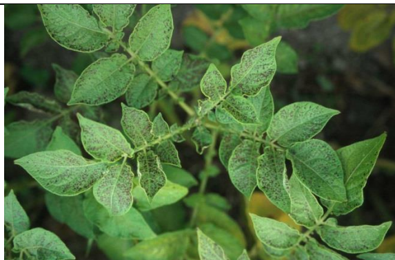
Mangaangebrek in aardappel: jonge bladeren tonen bruine vlekjes langs de nerven.

In granen geeft mangaangebrek bij een jong gewas gele en slappe planten, wat lijkt op veel andere problemen. De bladpunt blijft vaak groen, terwijl op oudere bladeren grijzige vlekjes ontstaan. Bij gerst liggen de bruine vlekjes op kenmerkende strepen over het blad. Bij aardappel worden de jonge bladeren gelig en krijgen rijen bruine vlekjes langs de nerven. Bij ernstig gebrek rollen de bladeren naar boven toe op en sterven af. Mangaangebrek in suikerbieten komt vrij veel voor. Bladeren krijgen gele, ingezonken vlekjes en gaan steil omhoog staan. Later sterven vlekjes af en vallen er gaten in het blad.