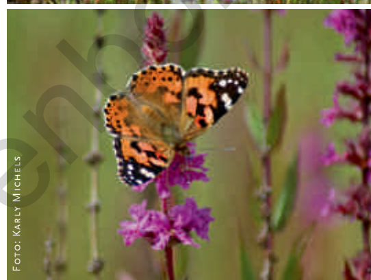
De rijke diversiteit aan planten in constructed wetlands trekt een zeer heterogene fauna aan. Deze foto's zijn genomen aan de installatie in West-Vleteren.

spectieven. Bovendien hebben constructed wetlands enkele belangrijke voordelen ten opzichte van het klassieke uitrijden van mest. Naast uiteraard een verminderde nutriëntendruk op het milieu en energiebesparing door minder langeafstandstransporten, blijken constructed wetlands in het bedrijf ook een mogelijke bron te kunnen worden voor herbruikbaar water. Op termijn kan de biomassa in de constructed wetlands economisch gevaloriseerd worden voor bio-energieproductie. Tenslotte hebben constructed wetlands door hun grote biodiversiteit ook een grote ecologische waarde. Constructed wetlands kunnen de druk van de landbouw op het milieu helpen verlichten en dus bijdragen tot de duurzaamheid ervan. Ze vormen een belangrijke schakel waardoor natuur, landbouw en mestverwerking hand in hand kunnen gaan. ■