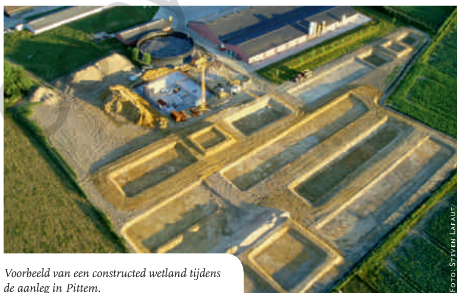
Voorbeeld van een constructed wetland tijdens de aanleg in Pittem.

Hergebruik van effluenten uit constructed wetlands zou in de toekomst een aantrekkelijke en duurzame optie kunnen worden om water voor landbouwbedrijfsvoering te voorzien. Er is echter diepgaand toegepast onderzoek nodig om na te gaan voor welk hergebruik het effluent in aanmerking komt. Voor hun baanbrekend werk rond deze thematiek werd Innova Manure in 2008 gelauwerd door de Boerenbond (Innovatieprijs 2008, categorie Milieutechniek). Meer recent werden de constructed wetlands ook opgenomen in een landbouwonderzoeksproject rond hergebruik van gezuiverde effluenten uit de mestverwerking (IWT 80504, 2009-2011). In dat project, een samenwerking tussen Universiteit Gent en het povlt, worden de mogelijkheden voor hergebruik in zowel laagwaardige (bijvoorbeeld speelwater in stallen) als hoogwaardige toepassingen (bijvoorbeeld drinkwater