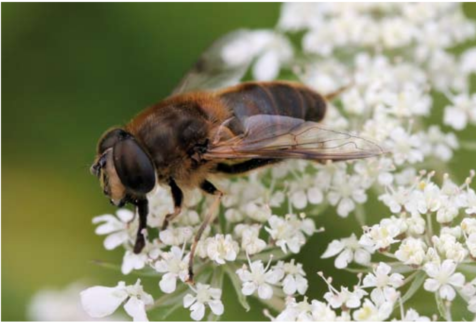
4. Blinde bij Eristalis tenax , de meest gevangen soort. Eristalis tenax , the most frequently caught species.

gen (figuren 2b en 3b). Afstand tot het natuurgebied heeft geen effect op de hommels.