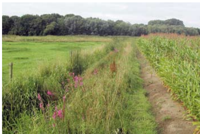
1. Een van de onderzochte slootkanten. One of the studied ditch banks

de extensivering van het landgebruik en het creëren van plekken met halfnatuurlijke elementen. Vaak wordt dit gestimuleerd door, door de overheid gefinancierde, beheersovereenkomsten. In landbouwkundig intensief gebruikte gebieden, zo-