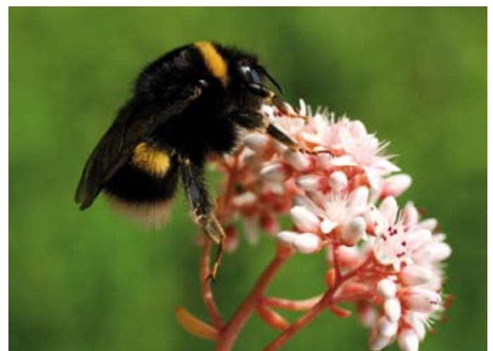
5. Bombus terrestris is langs vijf van de acht sloten aangetroffen. Bombus terrestris was found alongside five out of eight ditches.

Ook bijen reageerden sterk op de afstand tot het natuurgebied: tussen de rand van het natuurgebied en driehonderd me-