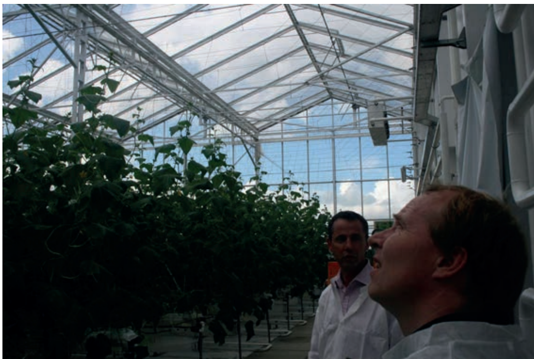
De overeenkomsten en verschillen met de VenLowEnergy kas zijn samen op het IDC vastgesteld