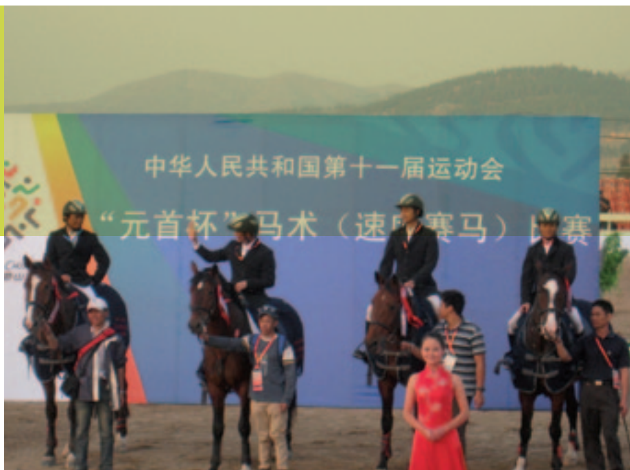
Team met KWPN-paarden wint National Games in Jinan.