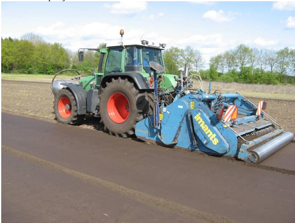
Foto. Imants Spitinjecteermachine

De Monam is toegediend met een Imants spitfreesinjecteur (zie foto).