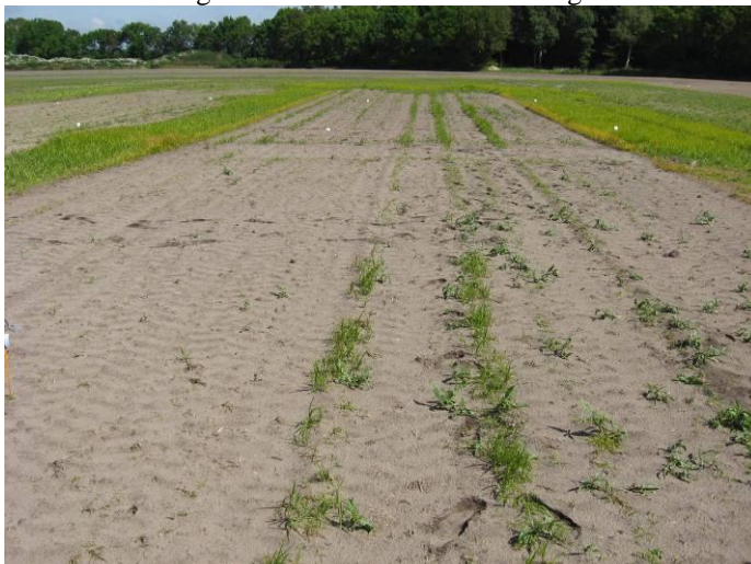
Foto. Onbevredigend resultaat door baanvorming.

Na de toepassing in april bleken er smalle banen met knolcyperus (zie foto) in het perceel aanwezig te zijn. Tussen de banen was het werking wel goed. Blijkbaar was de afstelling/werking van de apparatuur onvoldoende voor een optimaal resultaat. Het is bekend dat het afstellen van de machine grote gevolgen voor het resultaat kan hebben evenals slijtage van vitale machineonderdelen. Vooral de ruimte tussen de scharen is de zwakke schakel van de machine. Ondanks dat de scharen voor het seizoen 2009 vervangen waren was het resultaat van de toepassingen in april, juni en juli niet bevredigend. Door extra spuitdoppen te monteren (bij de toepassing in september en oktober) is geprobeerd om de werking te verbeteren. Ook voor het randje losse grond wat ontstaat bij de aansluitbanen dient een oplossing gevonden te worden. De in dit randje losse grond aanwezige knolletjes worden niet bestreden. De werking in de maand juli viel tegen. Door te veel groene delen op het moment van toepassen werd de bovenlaag onvoldoende afgedicht.