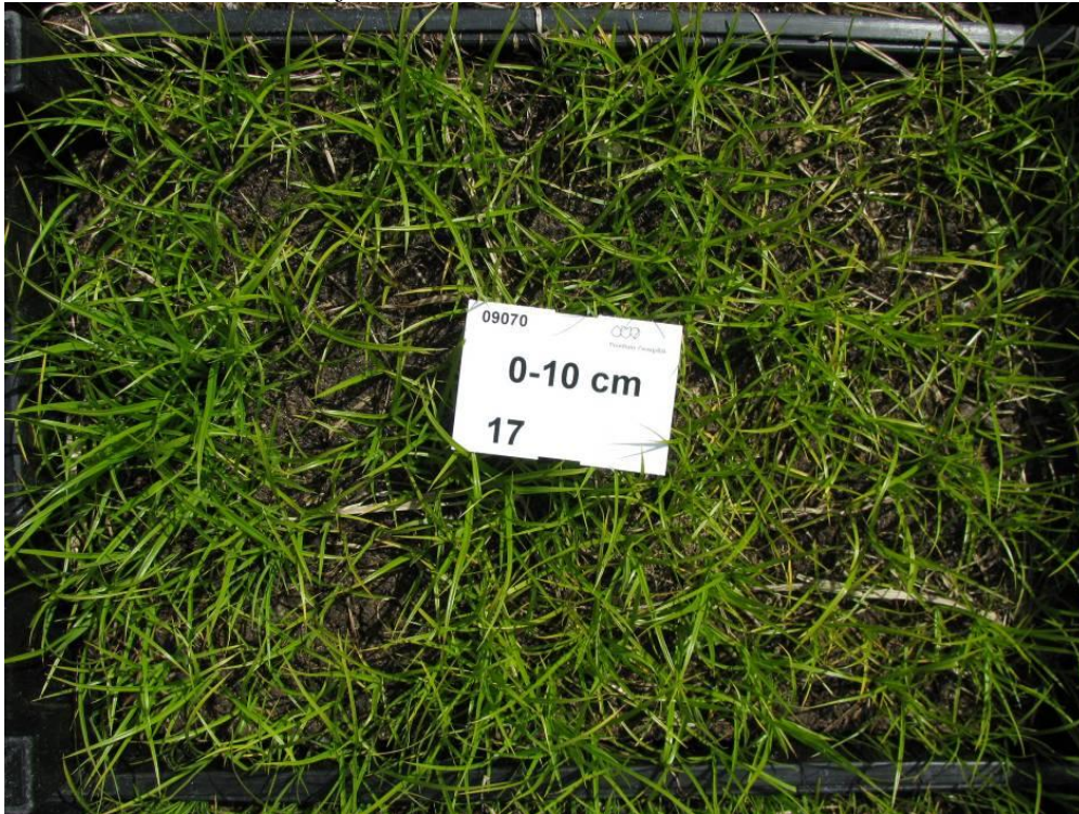
Foto. 750 l/ha Monam 0-10 cm juni