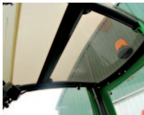
Het dakraam zorgt voor zicht naar boven, maar biedt weinig beschutting tegen de zon.