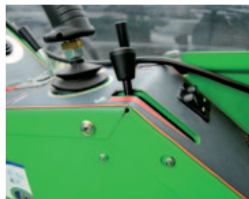
Het motortoerental regel je niet met het voetpedaal, maar met een handgashendel.