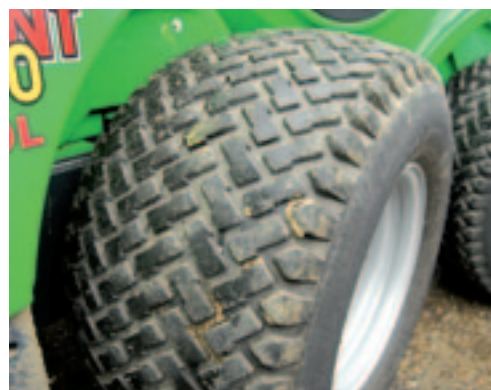
Brede banden blijkt voor gebruikers vaak een geliefde optie.