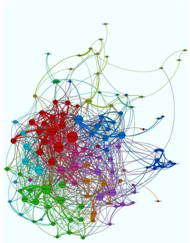
ICES expert group network

Naast een beperkt aantal vaste vergaderingen van de expertgroepen van STECF worden jaarlijks een aantal extra bijeenkomsten gehouden. Veelal wordt verzocht om ad hoc evaluaties of analyses uit te voeren. Deelname aan deze vergaderingen vindt plaats op uitnodiging van de EC. In een aantal gevallen worden ook niet Lidstaten zoals Noorwegen door de EC bij deze groepen betrokken.