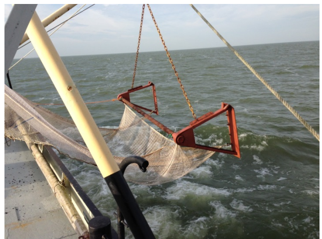
Uitzetten 4 meter kor op IJsselmeer

Tijdens de bestandsopname zal zowel met de 4 m boomkor (43 trekken gericht op schubvissoorten) als met de elektrokor (60 trekken gericht op aal en schubvis) worden gevist. De resultaten worden gebruikt bij de beoordeling en advisering van de visserij op o.a. aal, spiering, baars en snoekbaars, in analytische studies van de interacties tussen het waterbeheer, de visstand, de vogels en de visserij en bij de beoordeling van de ecologische toestand in het kader van KRW en VHR/Natura 2000. Deze bestandsopnames zijn een belangrijk instrument om effecten van te verwachten veranderingen in visserijdruk te evalueren.