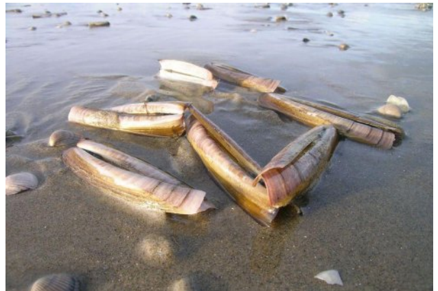
Mesheften ( Ensis )

Het onderzoek in de ondiepere delen van de Voordelta wordt uitgevoerd met een gecharterd kokkelvaartuig. In het resterende gebied wordt met een schip van de Rijksrederij gevist. De bemonsteringen worden uitgevoerd gedurende 9-10 weken in de maanden april – juni. Er wordt gevist met verschillende tuigen, afhankelijk van diepte en substraat: een bodemschaaf, een aangepaste zuigkor en een Van Veen happer. De monsterpunten zijn over het onderzoeksgebied verdeeld volgens een gestratificeerd grid, waarbij voor een efficiënte verdeling van de onderzoeksinspanning het gebied is verdeeld in een aantal strata: gebieden met een verschillende kans of verwachting op het voorkomen van mesheften, strandschelpen en kokkels (met name in de Voordelta). De indeling is daarbij gebaseerd op informatie uit eerdere bestandsopnames. In strata waar veel schelpdieren worden verwacht, is een fijner grid bemonsterd dan in strata waar lage dichtheden verwacht worden. In totaal worden in de gehele Nederlandse kustzone zo'n 850 locaties bemonsterd, waarvan 200 in de Voordelta.