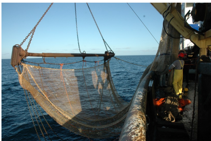
Uitzetten boomkor op de Tridens

De Demersal Young Fish Survey (DYFS) is een internationale bestandsopname uitgevoerd met een garnalenkor gericht op 0- en 1-jarige tong en schol en garnalen in de continentale kustgebieden van de Noordzee en aangrenzende estuaria. De survey geeft bovendien informatie over de veranderingen in de fauna van deze gebieden. De DYFS wordt uitgevoerd langs de kust met de Isis (5 weken in september en oktober), in de Zeeuwse estuaria met de Schollebaar (3 weken in september) en in de Waddenzee (4 weken in september en oktober) door de Stern. In verband met de voorgenomen vervanging van de vaartuigen Schollebaar en Stern is het mogelijk dat andere schepen voor deze survey zullen worden ingezet, mits ze overweg kunnen met het standaard tuig. Bij voorkeur zal er vergelijkend gevist moeten worden om te zien wat het effect van een scheepswissel is.