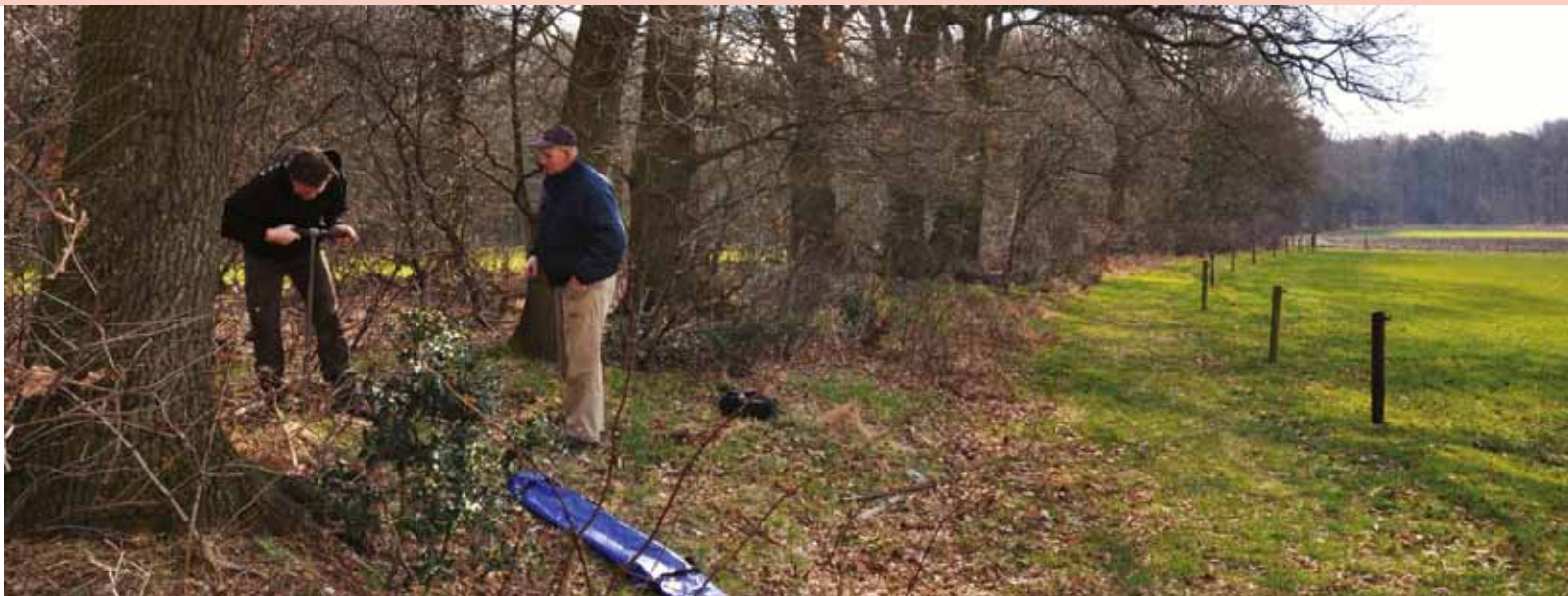
Uitvoering van grondboringen op landgoed 'de Driesingel' bij Meulunteren.