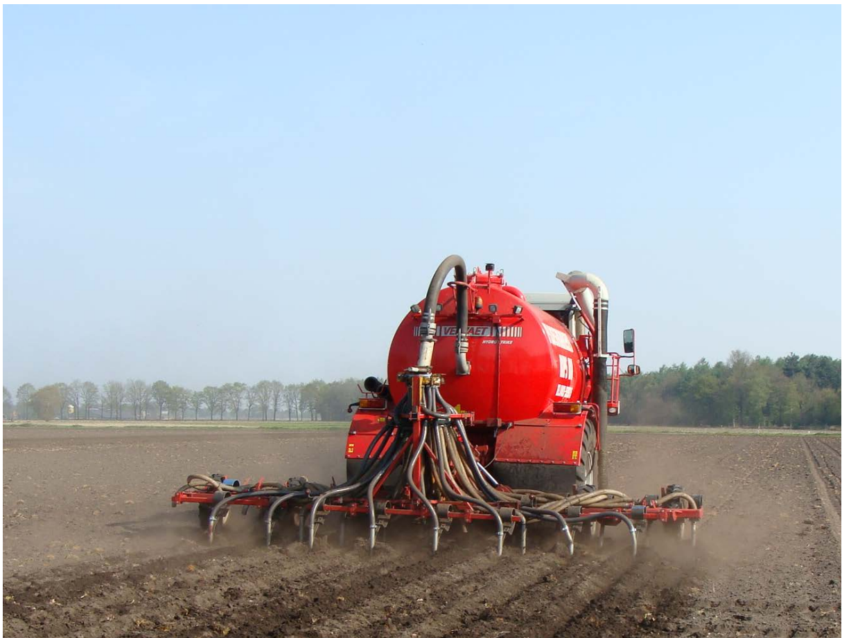
Digestaat wordt in de landbouw toegepast zoals dierlijk mest