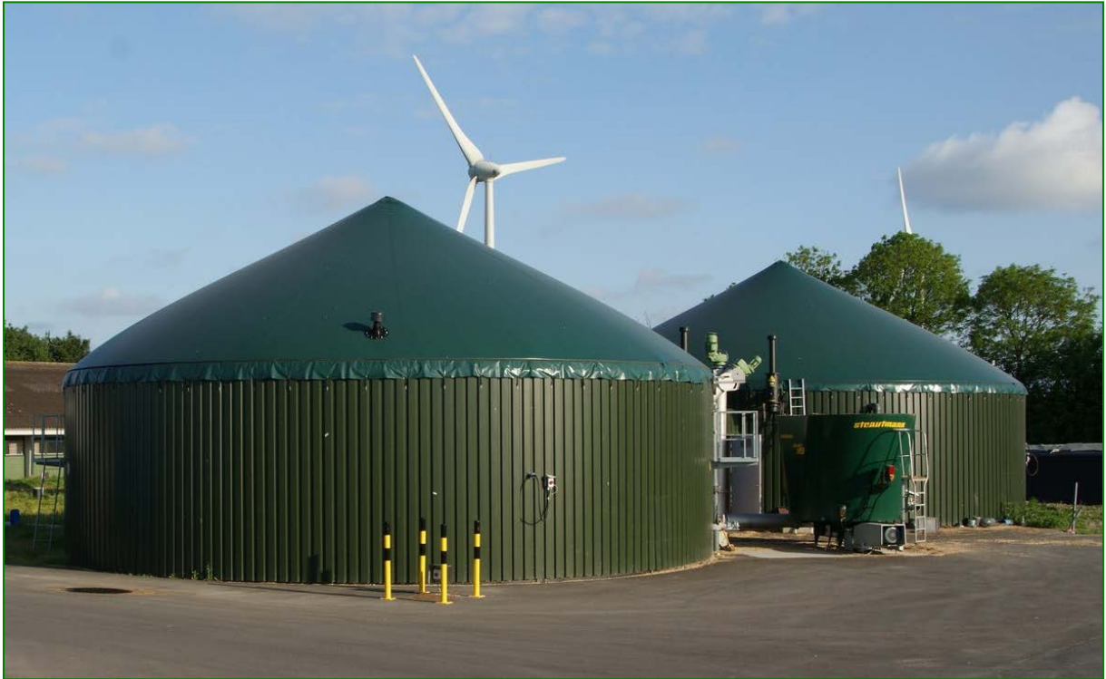
De mestvergister van Acres