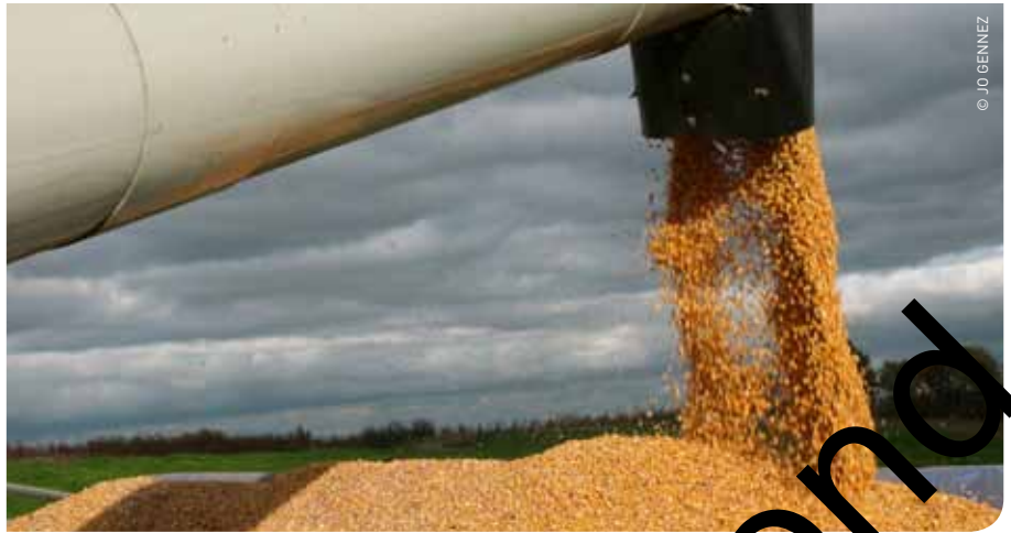
Rassen met een voldoende korte groeicyclus zijn noodzakelijk om bij de oogst tijdig een voldoende droge korrel te bekomen.

bruto-inkomen per hectare tegenover de standaardrassen weer. De rassen zijn gerangschikt volgens toenemend vochtgehalte. We zien dat de rassen die bovenaan gerangschikt zijn (laagste vochtgehalte) relatief stijgen in de rangorde qua bruto-inkomen. Bij de rassen in de onderste helft van de tabel zien we een omgekeerd fenomeen. Het is opvallend dat een ras als Coryphee dankzij een extreem laag vochtgehalte van 24% opklimt naar de top 5 van het bruto-inkomen. Ook Tiberio komt zo de top 5 binnen. De rassen P7631, P8057 en Amilac klimmen op naar de top 10. Het ras Grosso daarentegen zakt van de tweede plaats in de ranglijst opbrengst naar de veertiende plaats in de ranglijst