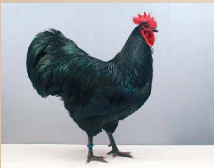
Zeer mooie Australorphaan, die nog een tikje meer ruglengte mag tonen. De staartvorm en afdekking is super!