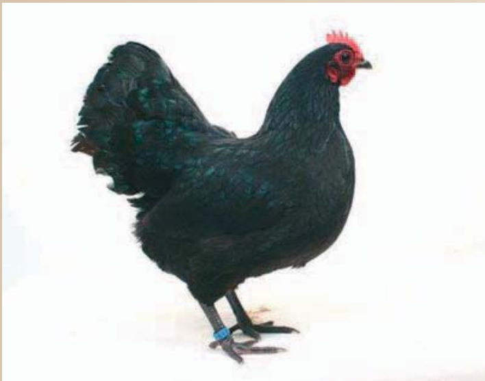
Mooie Australorpkielhen, de staart mag echter niet hoger en het gezicht en de kam moeten iets sprekender kersenrood.

De belangrijkste aspecten waar een Australorp op wordt beoordeeld zijn in feite maar drie criteria, namelijk (i) het type, (ii) de bevedering en (iii) de kop. Het leek ons leuk om juist in het Jubileumjaar van de Australorpclub eens te kijken wat de ontwikkeling van het ras in de laatste jaren is geweest en welke aandachtspunten er zijn. Deze zijn ook in het afgelopen keurmeesterscongres besproken. Daarbij is tevens besproken dat Australorps op een heel hoog niveau staan en er dus best kritisch en streng gekeurd mag worden. Wel moet het beoordelen constructief blijven en het keuren moet niet ontaarden in het zoeken naar fouten. Het is voor een keurmeester een hele opgave om een grote inzending Australorp(krielen) goed op een rij te zetten, zeker als je niet dagelijks met dit ras in aanraking komt. De verschillen (met name in de hennen) kunnen dan klein lijken, maar ze zijn er wel degelijk. Bij de verdere bespreking zal onderscheid gemaakt worden tussen de hanen en hennen, doch deze uiteenzetting geldt voor zowel de grote Australorps als Australorpkielen.