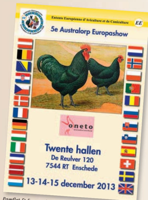
Pamflet 5 e Europashow te Oneto in 2013.

Wilt u meer informatie over Australorps of de 5 e rasgebonden Europashow voor Australorps en Australorpkrielen, dan kunt u het beste contact opnemen met de secretaris Aad Glas. Tel.: 0252-413222. De gegevens en nadere informatie kunt u ook vinden op www.kleindierplaza.nl of www.australorpclub.nl .