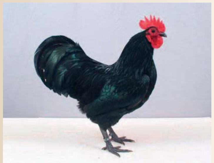
Australorpkielhaantje met een zeldzaam mooi type.