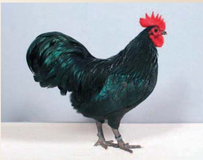
Australorphaantje welke bij de staartaanzet versmalt, zowel in de boven- als onderbelijning.

Van oudsher is het voor fokkers van de blauwgezoomde en witte Australorps moeilijk het niveau van de zwarte dieren te benaderen. Bij de witte dieren zien we de laatste jaren een opgaande lijn. Dit is mede gerealiseerd doordat we