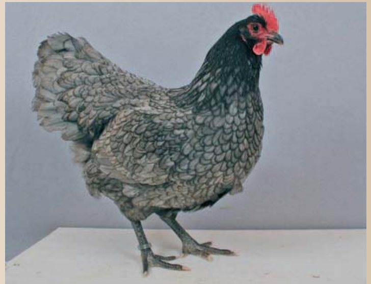
Sublieme Australorphen in blauwgezoomd welke in 2008 geheel terecht het predicaat U scoorde.

De Australorphanen zijn net als de hennen de afgelopen 25 jaren ook eleganter geworden en de stand is daardoor vrijer geworden. Hierdoor lijken de Australorphanen soms wat aan krachtige uitstraling te hebben ingeboed. Het meest opvallende bij de hanen is dat sommigen de vereiste borstdiepte en borstbreedte missen. Dit hangt natuurlijk ook nauw samen met welke hennen er wordt gefokt. Hanen dienen een mooie vol ronde en brede bostbelijning te hebben. Vlakke borsten zijn niet gewenst. Net als bij de hennen dient een haan ook enige ruglengte te laten zien. Hanen die te kort van rug zijn hebben niet het gewenste type. De staart en staartopbouw is bij een Australorpkriehen een belangrijk onderdeel van het type. Bij Australorphanen dient de staart breed aangezet te zijn, en vloeiend vanuit de rug een soepele opgaande lijn te laten zien. De oplopende lijn dient daarbij niet te steil te zijn en de staart dient zeker niet boven de