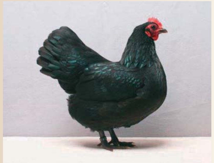
Mooie typische Australorpkielhen, die op de foto wat weinig ruglengte toont. Verder is de hen te laag gesteld.

De Australorphennen zijn de laatste 25 jaren eleganter geworden. De stand is daardoor vrijer geworden en ook echt heel donzige dieren komen we gelukkig zelden nog tegen. Daartegen zien wel dat sommige dieren wat te smal in bouw worden. Een Australorphen is niet allen een silhouet, maar dient over de gehele lengte ook breed te zijn. Hennen dienen ook een mooie ronde en volle borst te