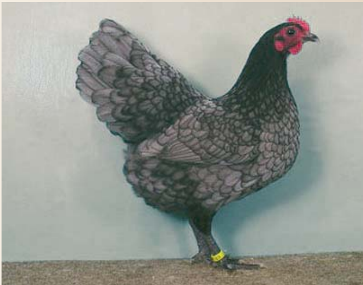
Duitse Australorpkriehen in Andalusisch blauw, toont een mooie zoming. Qua type is de staartlijn te steil en de rug te kort.

zijn; het moge duidelijk zijn dat een donker gezicht, maar ook lichte en rose kammen hieraan niet voldoen. Ook is op het keurmeesterscongres wederom besproken dat er meer aandacht gegeven dient te worden aan de beenkleur en minder aan de voetzolen. Als je aan de voetzolen kunt zien dat de Australorpkriehen witvlezig is, is dat goed. Als u het bovenstaande zo leest zult u begrijpen dat het fokken van een topdier zeker niet gemakkelijk zal zijn, er wordt immers nogal wat gevraagd van een Australorphanen.