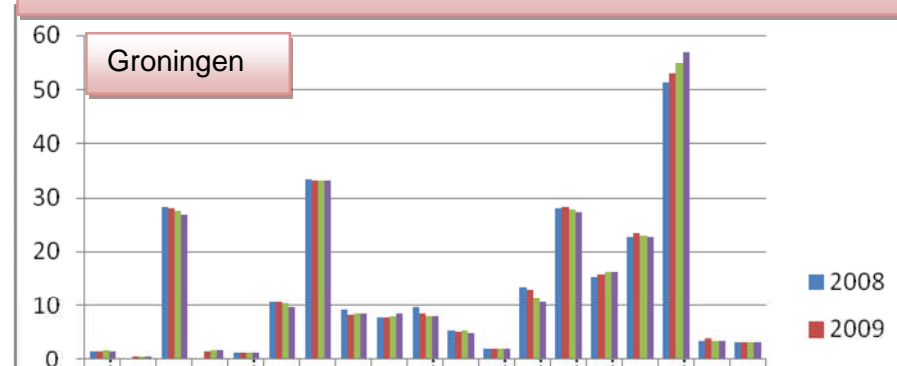
Totale werkgelegenheid per provincie, bron CBS

*) = vervangingsvraag (10%, tenzij specifiek bekend) x % groen opgeleid x % MBO