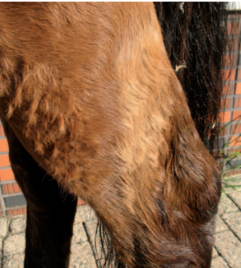
Zowel krullend als goudkleurig haar aan de achterbenen van een paard met de ziekte van Cushing, dat in aanleg bruin van kleur was.