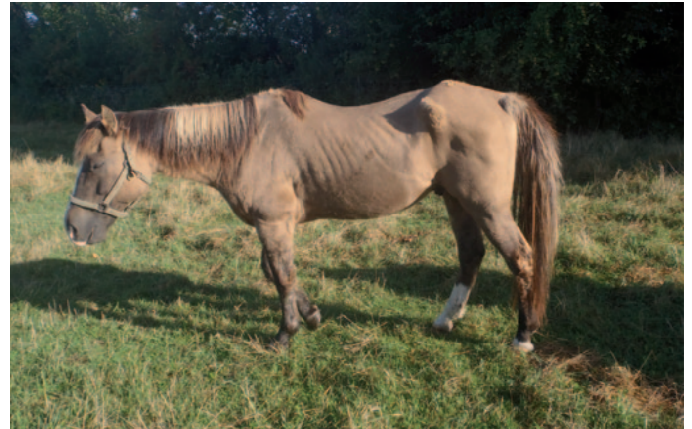
Een vermagerend paard met de ziekte van Cushing in september met nog immer goudkleurige winter-vacht op de heupbeensknobbels.