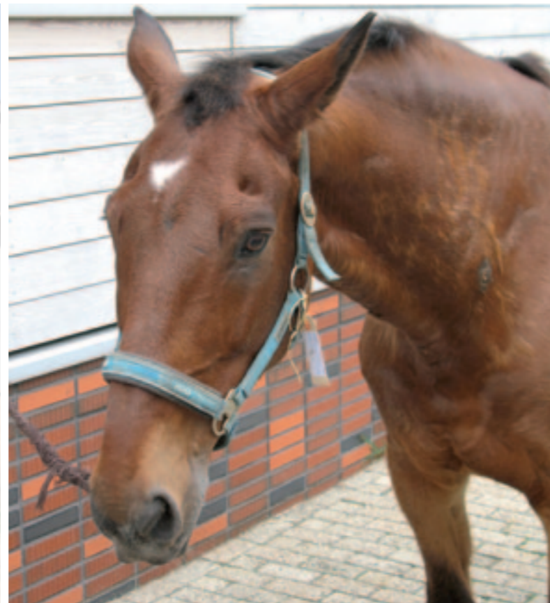
De ziekte van Cushing zonder vetkussentje boven de ogen.