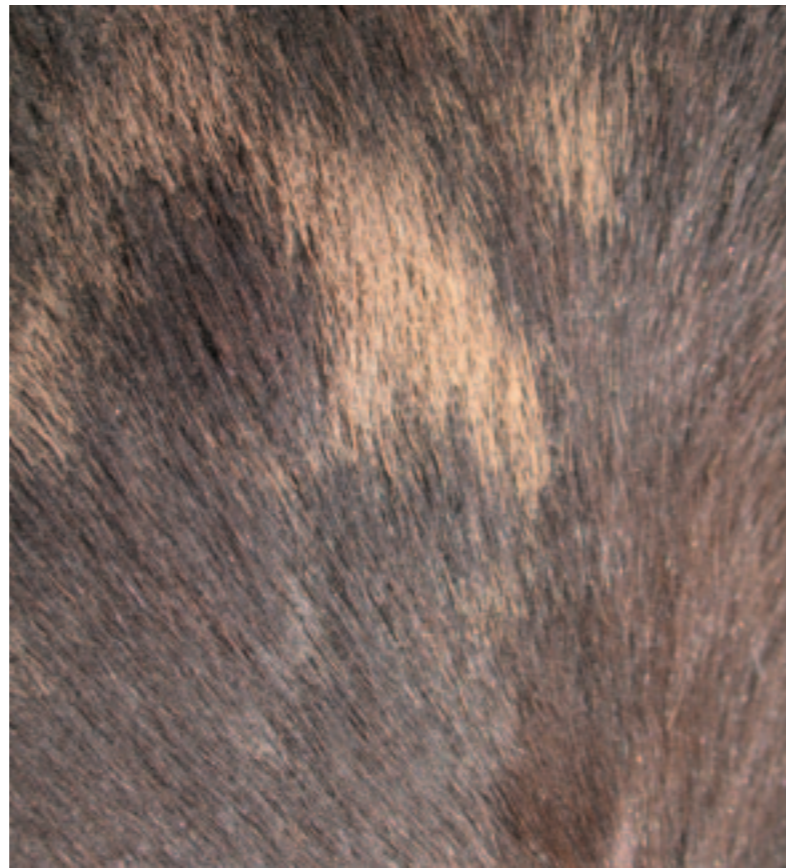
Close-up van goudkleurige verkleuring van een deel van de vacht bij een in aanleg bruin paard met de ziekte van Cushing.