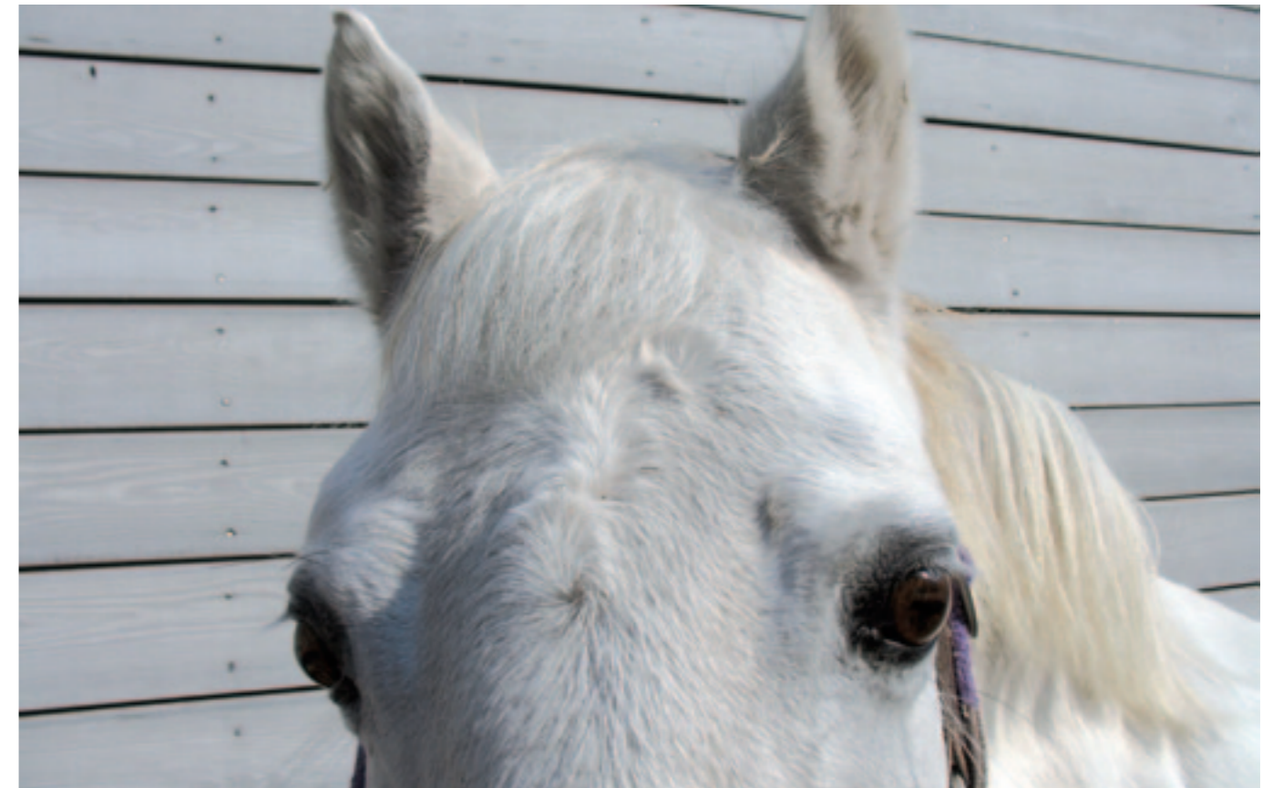
De ziekte van Cushing mét vetkussentje boven de ogen.