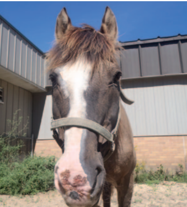
Close-up van een paard met de ziekte van Cushing. Opvallend is de goudkleurige beharing in de oorschelpen.

plassen en drinken, maar niet bij het paard. Paarden met de ziekte van Cushing vertonen meestal pas veel plassen en drinken als suikerziekte als complicatie is opgetreden. Andere zeldzamere complicaties van de ziekte zijn verhoogde gevoeligheid voor secundaire infecties,