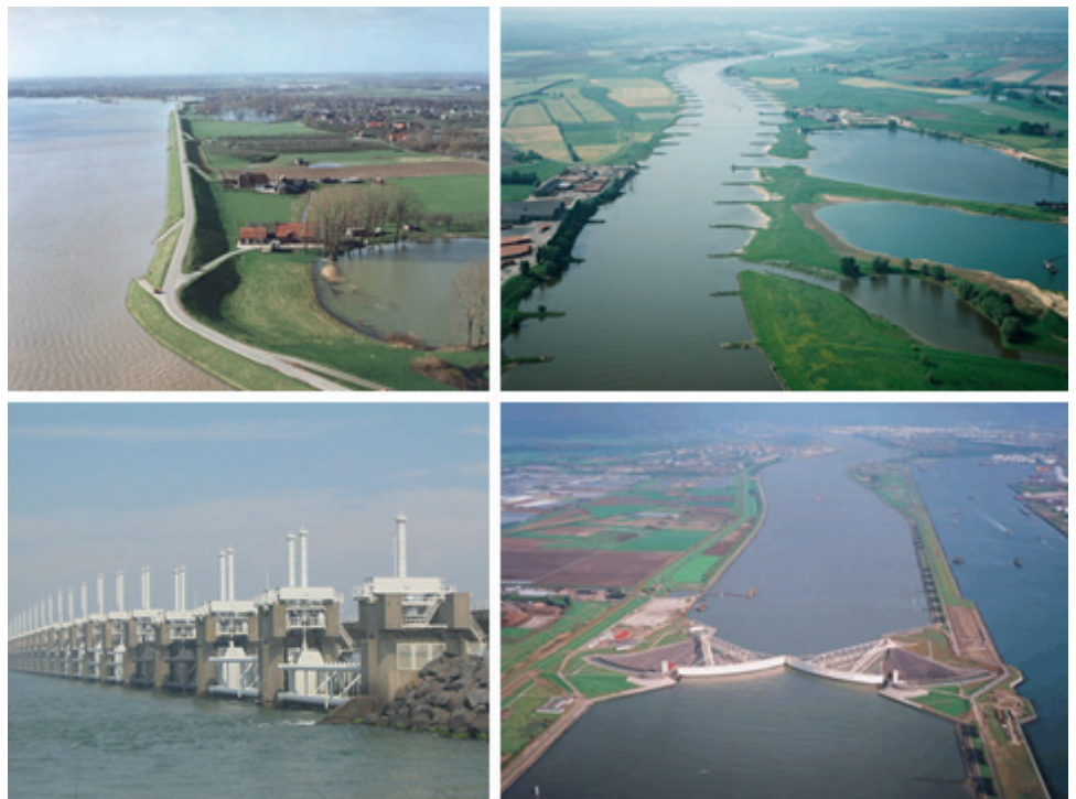
Afbeelding 1: Enkele grote waterbouwkundige ingrepen in Nederland: rivierdijken langs de Waal (linksboven), Pannerdens Kanaal (rechtsboven), Oosterscheldekering (linksonder), Maeslantkering (rechtsonder).

overstromingsverzekering en het doorsteken van de dijken en laten opslibben van het land zijn de afgelopen jaren voorgesteld. Onze minister heeft recent meerlaagsveiligheid omarmd. In haar brief aan de Tweede Kamer is aangegeven dat we dijken mogen gaan uitwisselen tegen ruimtelijke maatregelen en rampenbeheersing (Ministerie van IenM, 2013). Het is daarom goed om stil te staan bij de belangrijkste uitdagingen voor de beheersing van overstromingsrisico's in ons land.