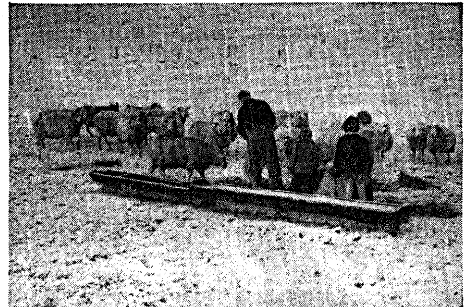
Tijdens het vreselijke weer van de vorige week hebben de schapen natuurlijk erg te lijden gehad. Bijvoederen was vanzelfsprekend het devies en velen prezen zich gelukkig als alle dieren teruggevonden werden.

Mangaangebrek komt op zandgronden zelden op gehele percelen, maar meestal op