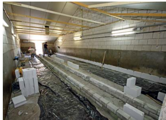
De twaalf vleesvarkensafdelingen worden omgebouwd naar kraamafdelingen.