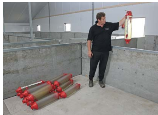
In de groepshuisvesting gaat Spanjers om financiële redenen vloervoeding toepassen.