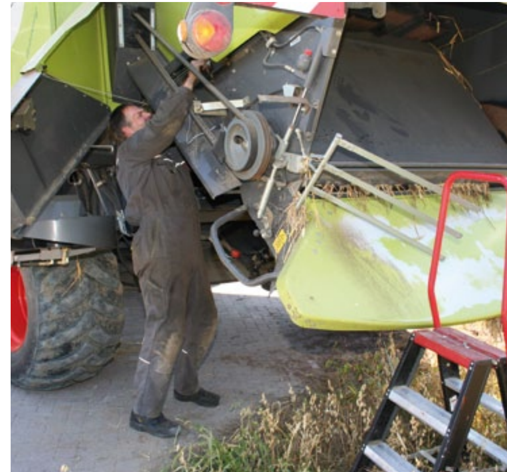
▲ 'De haspelautomat doet het niet'. Met die klacht wordt maaidorsermonteur Harm Coppens bij deze Claas Lexion 550 gehaald. Na het nodige speurwerk en het doormeten van draden, blijkt muizenschade de oorzaak. Precies achter een kap hebben de diertjes een draad blootgeknaagd (foto rechts). Het draad is ooit eens los op de bek aangebracht, zodat de eigenaar, loonbedrijf Van Ginneken, het voorzetstuk ook op de andere maaidorser kan gebruiken. Na het monteren van een nieuw draad kruipt Coppens nog even onder de achterkant van de maaidorser. Een van de sensoren van de verliesindicator is stuk en wordt ook vervangen.