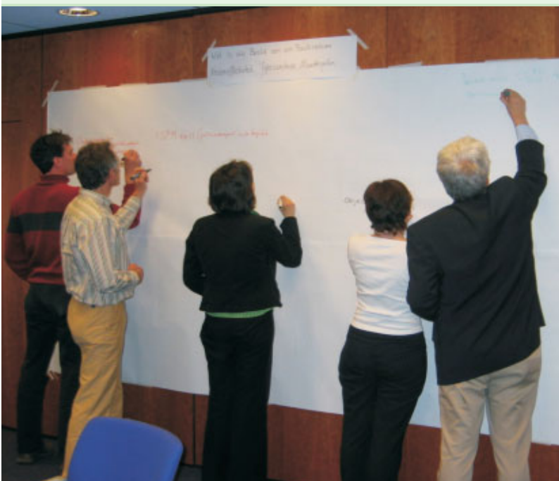
Workshop 13 april 2005: inventariseren van beelden en behoeften.

Het resultaat van deze voorstudie vormt een goede en gedragen basis voor het ontwikkelen van een concreet model of beslisschema voor het nemen van fyto-sanitaire maatregelen.