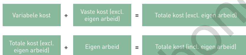
Figuur 1 Methodiek economische resultaten