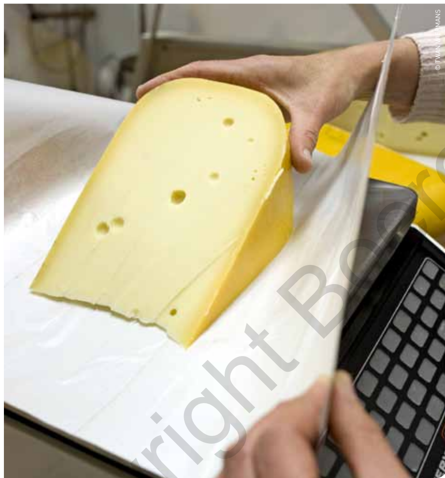
De evolutie inzake melkvalorisatie toont dat tussen 2005 en 2012 8% meer verse zuivel- en kaasproducten werden geproduceerd.

De investeringen nemen na de piek van 2011 nog verder toe. De zuivelindustrie investeert in 2012 een recordbedrag van 152 miljoen euro. In de periode 2005-2010 investeerde de zuivelindustrie jaarlijks gemiddeld zo'n 90 miljoen euro. In 2011 én in 2012 liepen de investeringen op tot een jaarlijks gemiddelde van zo'n 150 miljoen euro. Dit is een toename met maar liefst twee derde!" De laatste 2 jaar wordt elke 1 op de 8 euro van de investeringen in de Belgische voedingsindustrie gerealiseerd in de zuivelindustrie. De zuivelindustrie gelooft rotsvast in de toekomst van de zuivelsector in ons land en bereidt zich hiermee voor op het postquotumtijdperk na 2015. De realisatie van voldoende verwerkingscapaciteit is een sterk positief signaal naar de melkleveranciers toe. Er zijn regio's in de EU, die ondanks hun productiepotentieel, minder perspectieven hebben inzake voldoende verwerkingscapaciteit", stelt Debergh. "In tegenstelling met de situatie in Frankrijk, waar de zuivelindustrie – die hoofdzakelijk privaat georganiseerd is en in belangrijke mate consumentenproducten voortbrengt – geen behoefte heeft om al de melk van hun leveranciers na 2015 af te nemen. De door de overheid opgelegde contracten komen daarbij goed van pas en bevatten volumebeperkingen, die nadelig dreigen uit te draaien voor de melkveehouders". ■