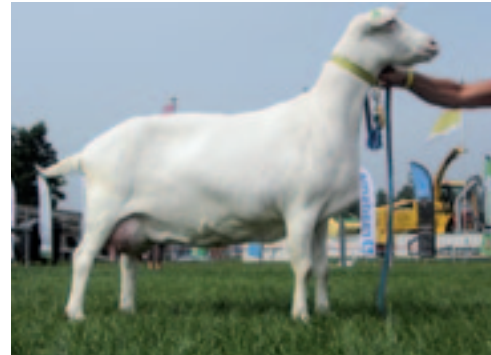
Tsjeppebûrster Aleida 288 is de geit waar de Gina's van afstammen.