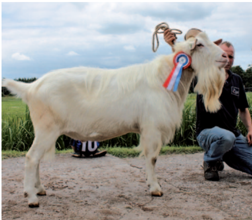
Jens (Kûkhermster Sjouke 8 x Tsjeppebûrster Aleida 253) werd in 2012 kampioen in Jubbega.