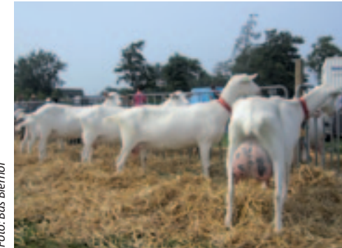
De geiten van Siep van der Let tijdens de Friese keuring 2013 in Wouterswoude.