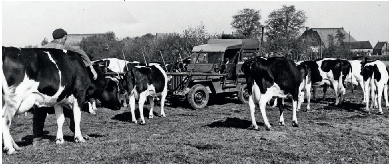
De hele melkveestapel werd aan de buizen van de jeep gebonden: de melkers konden los

van koeien hielden, zegt hij: 'Dat was bij mijn vader het geval niet, maar hij had zijn aandacht nodig voor het akkerland. De zware kleigrond rond de oude Waddendijk was nauwelijks te bewerken en daarom hielden we koeien en schapen. Ook de paarden hadden gras en hooi nodig. En van onze medewerkers was er één die met z'n vrouw de koeien verzorgde. Wanneer die ziek was, hadden we een probleem.'