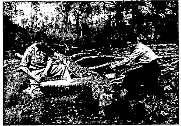
Doorkorten met de lange trekzaag met Amerikaanse betanding.