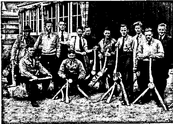
Cursisten en leerkrachten met de werkstukken (eerste RAB cursus).