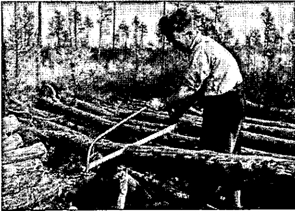
Korten van mijnhout met de beugelzaag met EIA betanding.