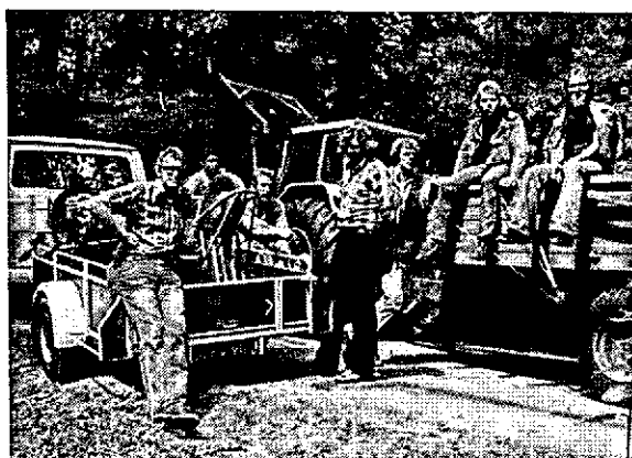
Leerlingen, deelnemers aan de eerste cursus "oeververdediging", gaan van het oefenobject naar huis.