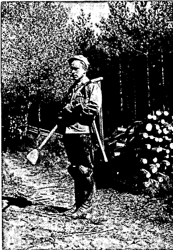
Gereedschap van de eenmansploeg: beugelzaag, Iltis bij en Dauner schiltschop.

Doch niet alleen ten opzichte van genoemde scholen, ook ten aanzien van het leerlingstelsel in de bos-