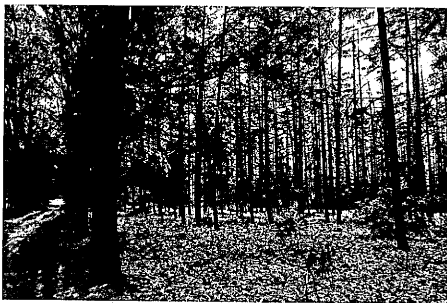
Boven en onder: specifiek beeld van bos met als doelstelling instandhouding van landgoedkarakter met houtproductie nevestigeld. De Dorschkamp.