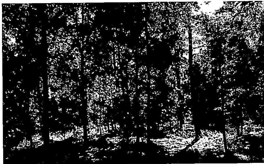
Specifiek beeld van bos met natuurbehoudsdoelstelling; minimale menselijke beïnvloeding. Bennekomse Bos.

Voor het "Bennekomse Bos" werd een verband