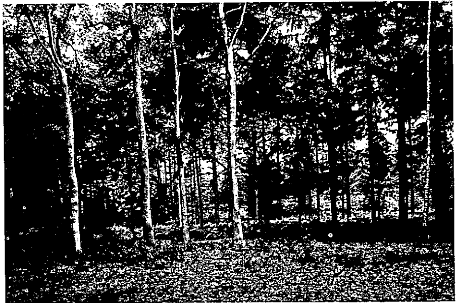
Boven en onder: specifiek beeld van bos met houtproductie als hoofdfunctie, Oranje Nassau's Oord*).