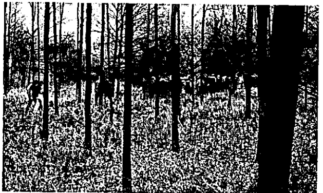
Excursie in het eikenbos van Singraven.

Op "Singraven" een landgoed dat voor de Edwina van Heek Stichting door de Koninklijke Nederlandsche Heidemaatschappij beheerd wordt, wachtte het gezelschap een geestrijk onthaal.