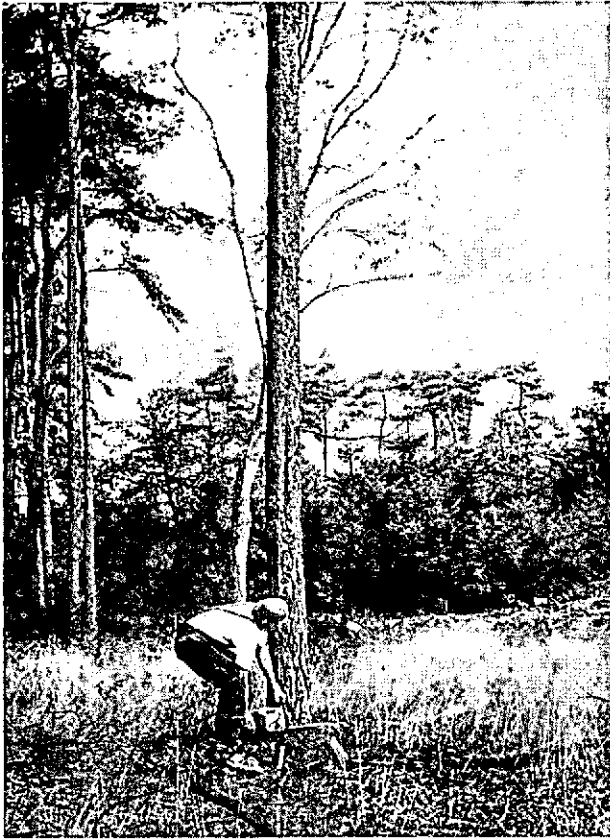
Nog steeds arbeidsintensief