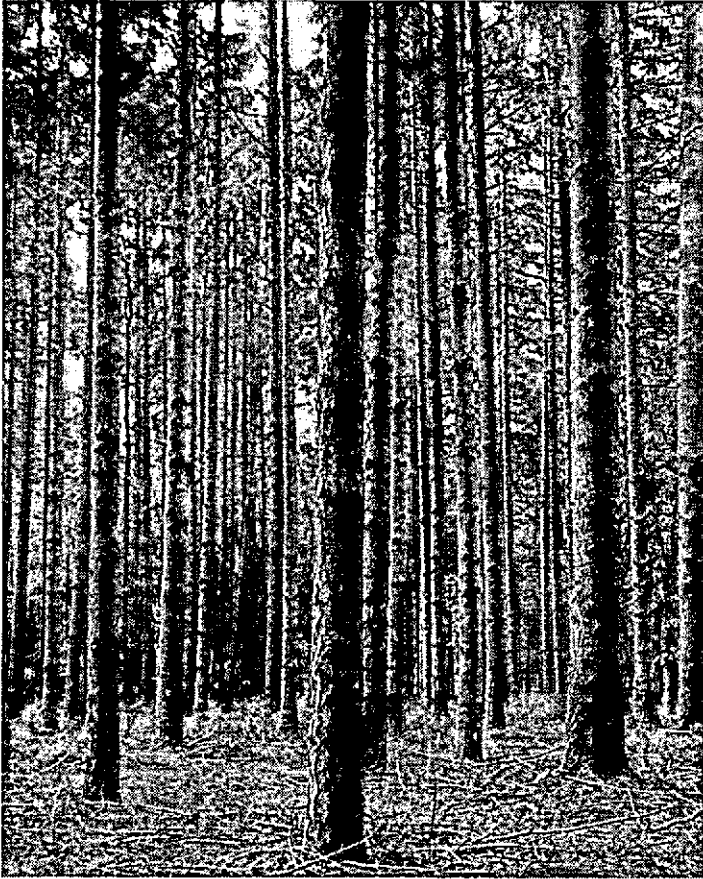
Opstand van douglas. Houtvesterij „Apeldoorn“.