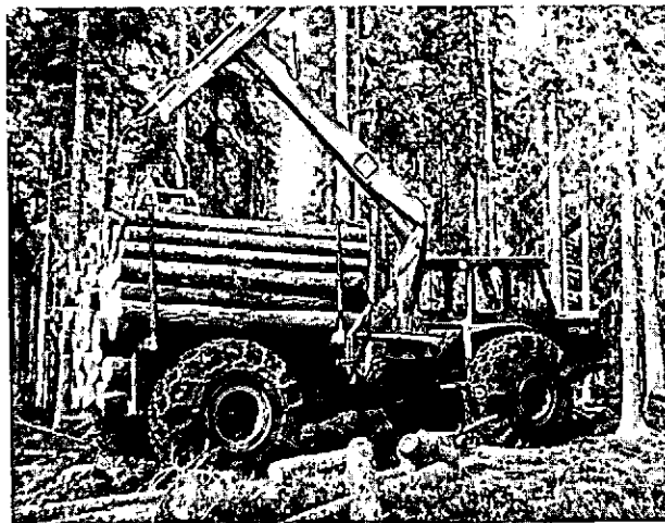
Forwarder tijdens het uitrijden van hout in Zweden